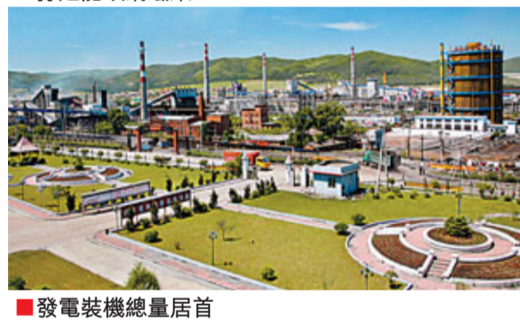
發電裝機總量居首