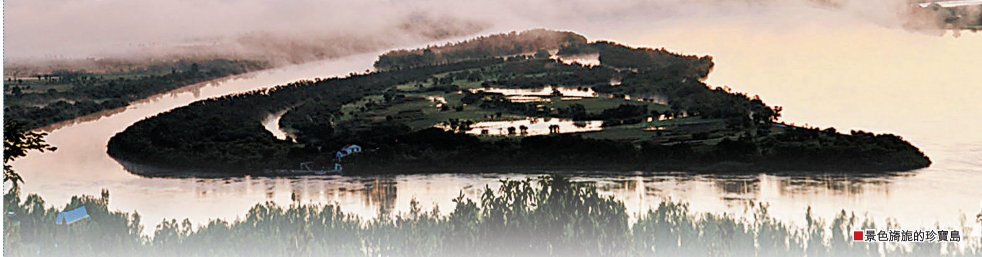
景色旖旎的珍寶島