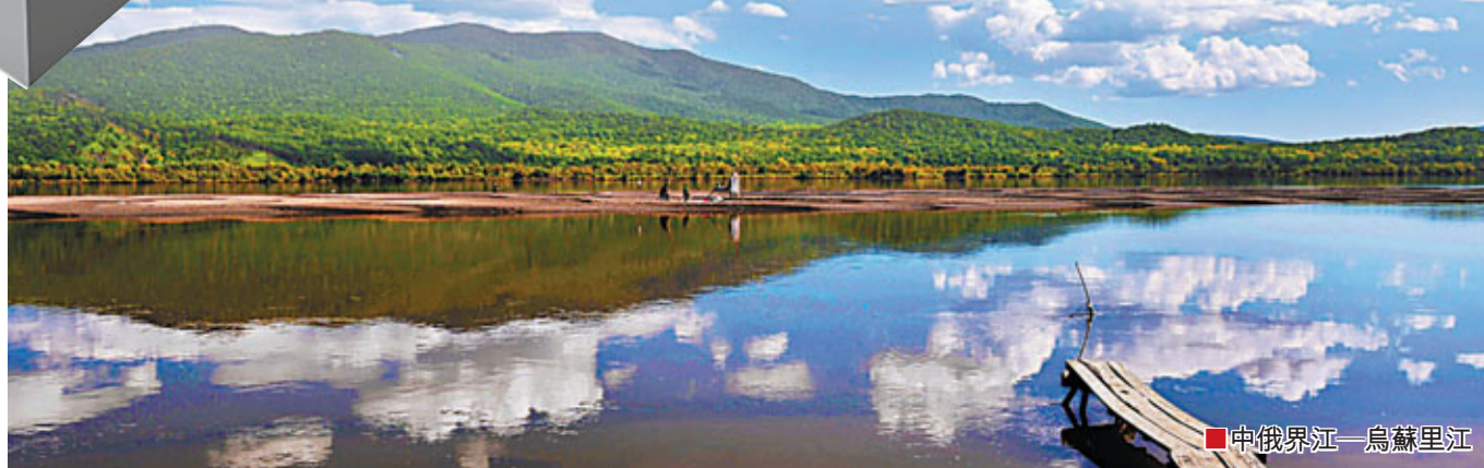
中俄界江—烏蘇里江