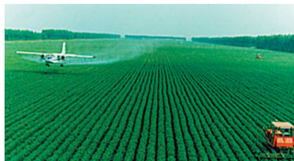
現代農業航化作業