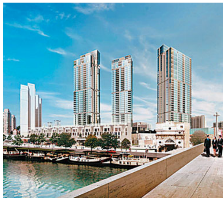
「皇冠上的明珠」——蘇河灣一號街坊效果圖

實施歷史人文戰略，引入一道「時光縱軸」。 歷史文化元素是蘇河灣又一卓越的先天稟賦。在西藏北路、浙江北路之間區域，將塑造一條串聯起蘇河灣過去、現在和未來的時光軸線。在未來的蘇河灣，這條絢爛的「時光縱軸」將成為支撐起蘇河灣開發的動力，讓見證光榮的四行倉庫、商賈雲集的上海總商會、百年滄桑的石庫門建築、巍然矗立的高樓大廈等和諧共生，提升蘇河灣地區的整體價值。