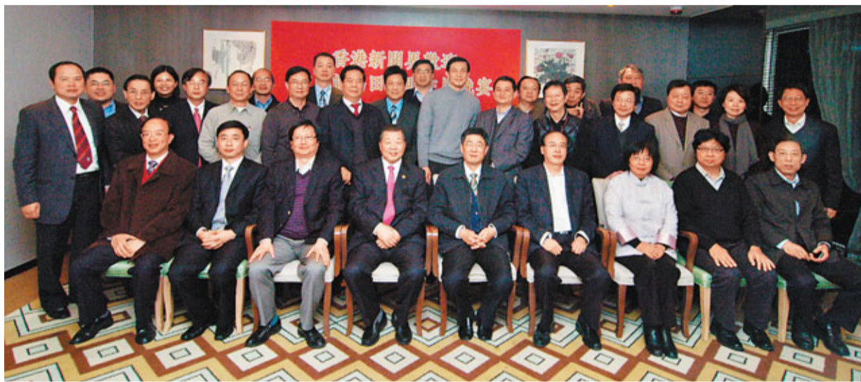
香港新聞界假銅鑼灣世貿中心宴請中國記協主席田聰明(前排右五)一行。