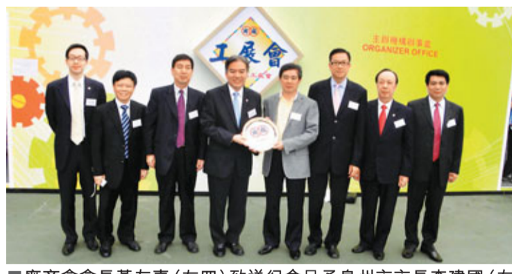
廠商會會長黃友嘉(左四)致送紀念品予泉州市市長李建國(右四)。