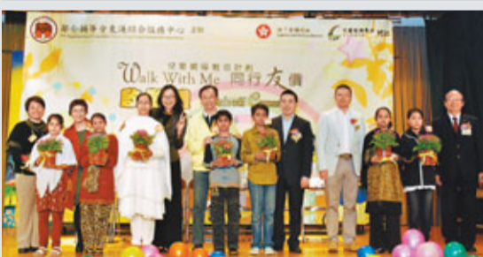
由鄰舍輔導會東涌綜合服務中心舉辦、兒童發展基金贊助的「同行友價」啟動禮日前舉行。

香港文匯報訊 由鄰舍輔導會東涌綜合服務中心舉辦、兒童發展基金贊助的「同行友價」啟動禮日前舉行。啟動禮邀請社署署長聶德權，贊助人李文斌及鄰舍輔導會總幹事董志發蒞臨擔任主禮嘉賓。