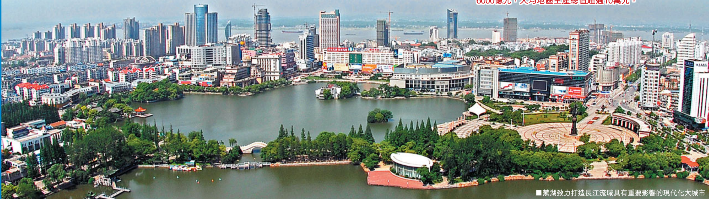
■蕪湖致力打造長江流域具有重要影響的現代化大城市

安徽蕪湖是長江流域的重要城市，也是安徽省加快發展的中心城市之一。過去五年的「十一五」期間，蕪湖經濟社會發展速度進一步加快，增長質量進一步提高，發展後勁進一步增強，為持續發展打下良好基礎。面向未來五年的「十二五」期間，蕪湖提出，以全面轉型、率先崛起、富民強市為主線，全面實施「創新驅動、產業強市、統籌城鄉、和諧發展、開放合作」五大發展戰略，推進皖江城市帶承接產業轉移示範區、合蕪蚌自主創新綜合試驗區建設，促進產業高端化、城市現代化、環境生態化，建設創新蕪湖、優美蕪湖、和諧蕪湖、幸福蕪湖，把蕪湖建設成為全國重要的先進製造業基地、綜合交通樞紐、現代物流中心、創新型城市和長江流域具有重要影響的現代化大城市。「十二五」期間，蕪湖將累計完成全社會固定資產投資1萬億元，力爭到2015年，實現地區生產總值達到2800億元，工業銷售收入突破6000億元，人均地區生產總值超過10萬元。