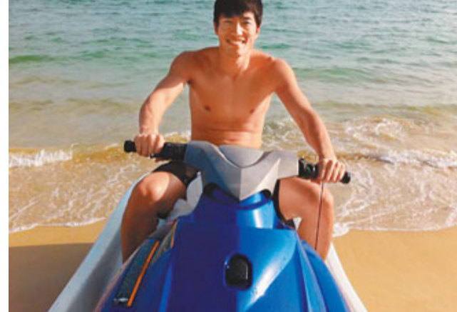
■劉翔難得享受陽光與海灘。

香港文匯報訊 赴海南出席體育世博開幕禮的中國110米欄「飛人」劉翔，並沒有如往日般參加活動後立即返回原訓練地，而是留在當地享受陽光與海灘。他甚至在自己的微博上大肆展示自己的快樂時光。他還感慨地寫道：「海闊天空，感覺自己又看明白很多事物！」 不過，放鬆的生活畢竟是短暫的。據《新報》報導，劉翔將在下一周前往美國進行康復訓練，這將是劉翔今年第三次出國進行康復訓練。 儘管劉翔在廣州亞運會上跑出了不錯的成績，可孫海平和劉翔都清楚，要想征戰國際賽場，現在的實力還遠遠不夠。孫海平透露，希望劉翔能在1月中旬回滬後的