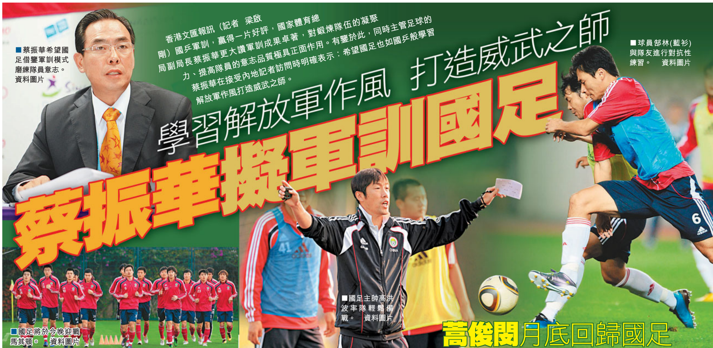
■蔡振華希望國足借鑒軍訓模式磨練隊員意志。資料圖片

香港文匯報訊 (記者 梁啟剛) 國兵軍訓，贏得一片好評，國家體育總局副局長蔡振華更大讚軍訓成果卓著，對鍛煉隊伍的凝聚力、提高隊員的意志品質極具正面作用。有鑒於此，同時主管足球的蔡振華在接受內地記者訪問時明確表示：希望國足也如國兵般學習解放軍作風，打造威武之師。