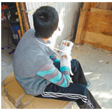
■ 被斬斷手筋的初二學生小韋(化名)右手纏着繃帶。

們同行的大約有10個同校的學生,經過市場附近時,那群男青年開了3、4部摩托車突然圍上來,他們都帶着長刀和鋼管,沒頭沒腦的亂斬亂打。但小韋否認對方是尋仇報復的,因為他從不結怨,也不認識對方。而比小韋更糟的是該校初三級的一個男生小勇(化名)。他的雙腿都被對方砍中,腳筋也被斬斷。