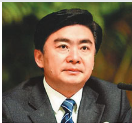
■ 王瑩說將對社會建設工作進行一個更為細緻的部署。

據中通社24日電 深圳市委書記王瑩23日出席會議時指出,經濟高速發展為深圳市帶來繁榮,同時亦帶來了不少社會問題,其中以市民缺乏「家園意識」及社會存在「浮躁心態」最為明顯,認為將影響到社會穩定性。