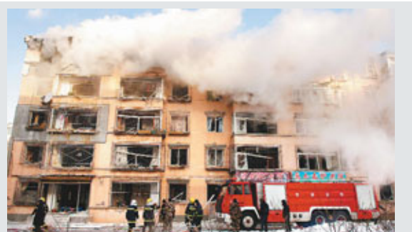
■ 24日,吉林市徐州路附近一住宅小區發生天然氣爆炸,波及6棟居民樓,約千餘居民轉移。新華社

時,安徽、浙江等地部分地區氣溫驟降16至18℃,安徽寧國氣溫一日之間驟降達18.3℃。24日,降溫地帶明顯南移,陝西、黃淮、江淮、江漢、江南、華南、西南地區等地將出現6-8℃降溫,局部降溫可達10-12℃。未來三天,南方還將有大範圍雨雪天氣,其中,湖北、安徽等地有中到大雪或雨夾雪。