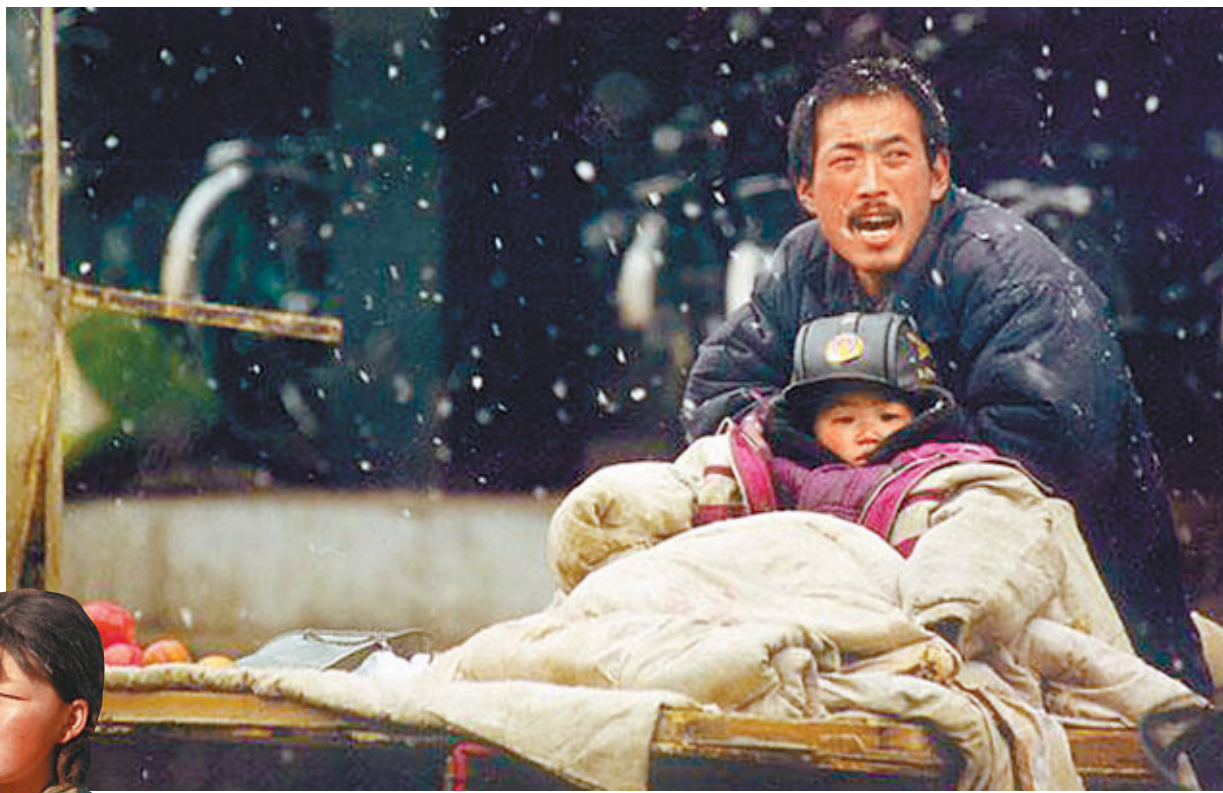
■ 中國未來十年扶貧開發任務艱巨,返貧壓力仍然較大。圖為中年菜販冒著風雪攜兒子在街頭叫賣,兒子紅撲撲的臉和父親因嘶喊而扭曲的表情相呼應,讓觀者為之心顫。

與此同時,記者獲悉,儘管2011年的扶貧新標準大幅上升,但和國際水平相比仍然較低。中國內地的國內生產總值及人均生產總值已超過印度3倍以