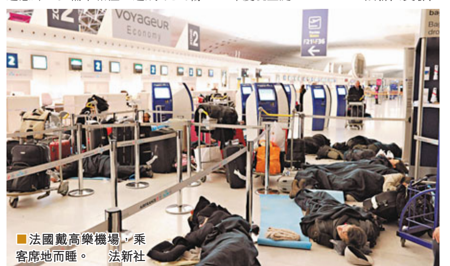
法國戴高樂機場，乘客席地而睡。