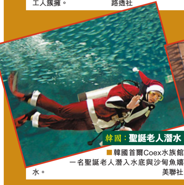
韓國：聖誕老人潛水