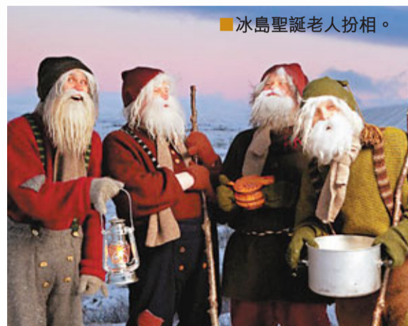
冰島聖誕老人扮相。