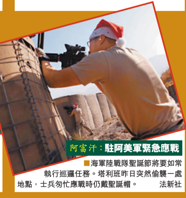
阿富汗：駐阿美軍緊急應戰

海軍陸戰隊聖誕節將要如常執行巡邏任務。塔利班昨日突然偷襲一處地點，士兵匆忙應戰時仍戴聖誕帽。