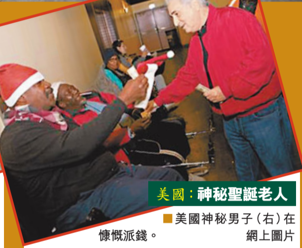
美國：神秘聖誕老人