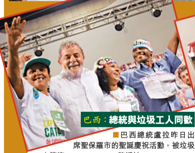
巴西：總統與垃圾工人同歡