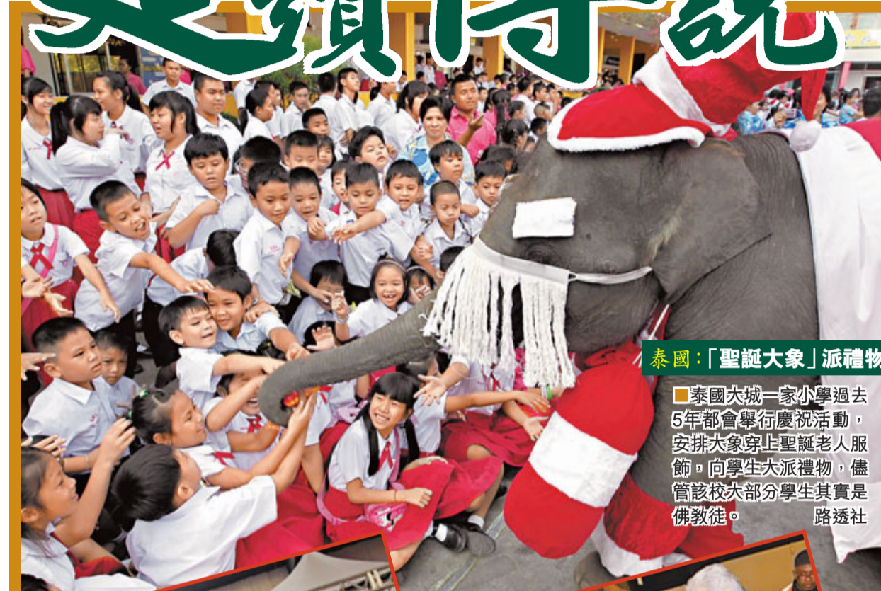
泰國：「聖誕大象」派禮物

泰國大城一家小學過去5年都會舉行慶祝活動，安排大象穿上聖誕老人服飾，向學生派禮物，儘管該校大部分學生其實是佛教徒。