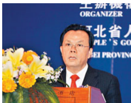
邯鄲市市長郭大建。