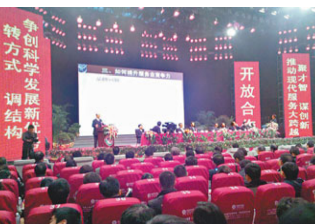
中國(衡陽)服務業改革發展高級研討會現場。