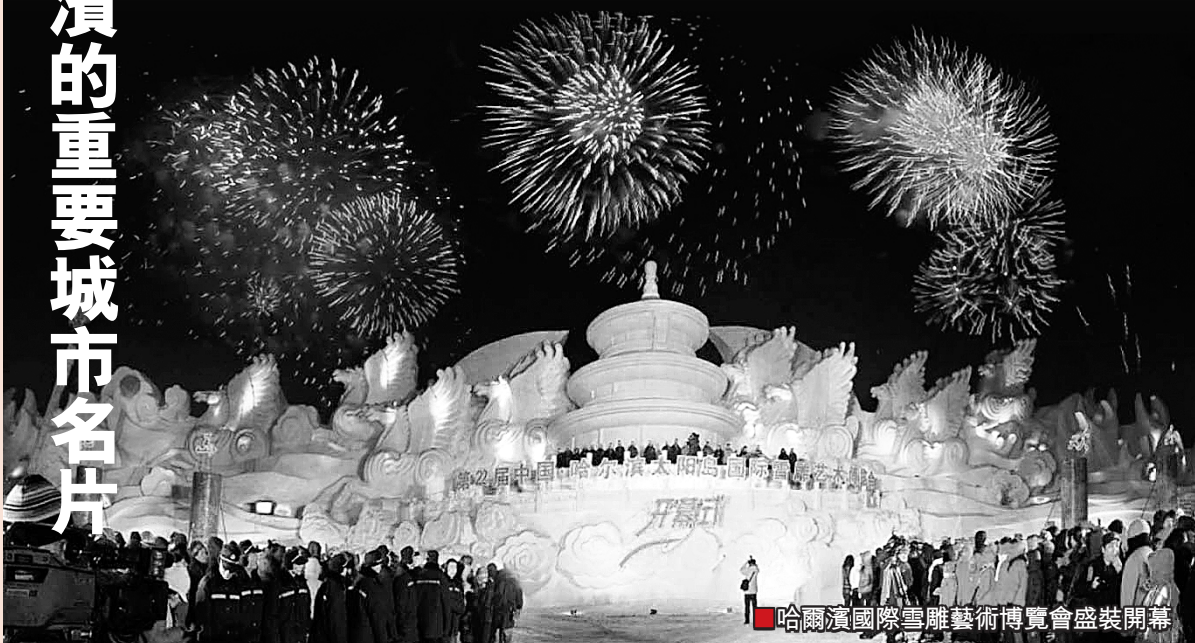
■哈爾濱國際冰雪藝術博覽會盛裝開幕

哈爾濱國際冰雪節是世界上活動時間最長的冰雪節，前一年年底慶活動便已開始，一直持續到2月底冰雪活動結束為止，期間包含了新年、春節、元宵節、滑雪節四個重要的節慶活動，可謂節中有節，節中套節。冰雪藝術、冰雪文化、冰雪旅遊、冰雪體育、冰雪經貿等200餘項活動在銀白的世界裡有聲有色地開展起來，中國北方名城霎時變成了碩大無朋的冰雪舞台。哈爾濱國際冰雪節目前已成為重要的城市名片，哈爾濱國際冰雪節與日本的札幌雪節、加拿大的魁北克冬季狂歡節和渥太華冬樂節齊名，並稱世界四大冰雪節。