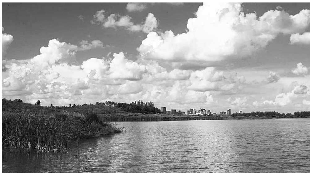
■城市與濕地呼應，盡展生態美景。