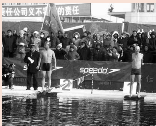
■冬泳——勇敢者的遊戲。

就氣候而言，哈爾濱夏季最熱的7月氣溫平均24度，晝夜溫差大，涼爽宜人，當南國飽受40度以上高溫炙烤的時候，哈爾濱人正在享受夏日的陽光。作為最大的省會城市，哈爾濱有國家森林公園12個，有縱橫交錯的河流，星羅棋佈的湖泊，40多個自然保護區，30餘個以自然資源為依