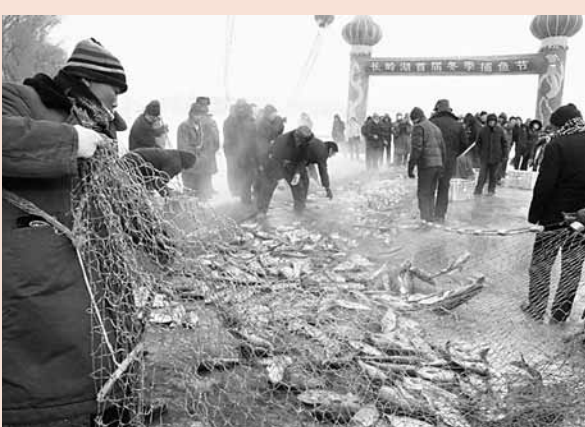
■哈爾濱長嶺湖首屆冬季捕魚節

基地發展成果聯展，黑龍江動漫基地、深圳動漫基地、吉林動畫學院、大連動漫基地等將帶來基地企業最新成果。展會期間，還將進行遊樂玩具、時尚動漫禮品、動漫卡通形象的授權產品、動漫遊戲光盤、動漫玩具、卡通服飾、模型、電子遊戲等衍生產品的展示和銷售。