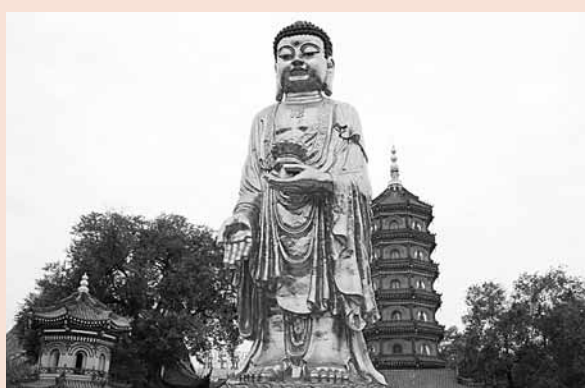
■哈爾濱極樂寺既是佛教徒參禪朝拜的北方佛教聖地，也是中外遊人觀賞遊覽的名勝所在。