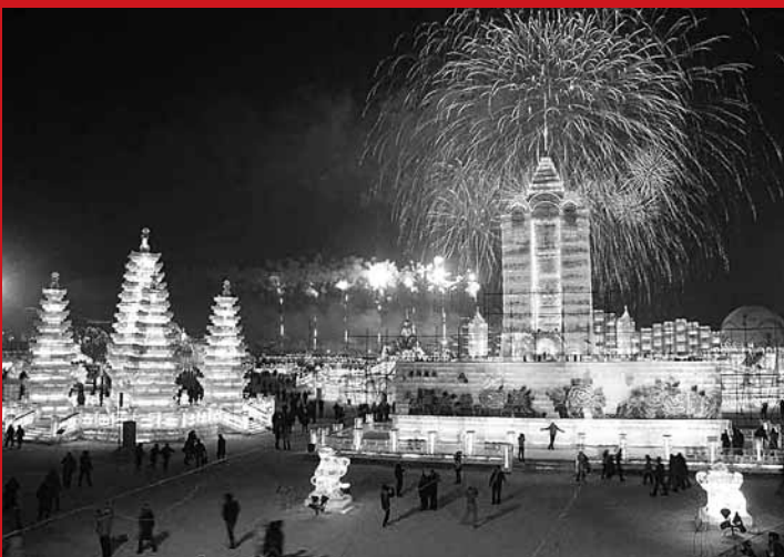
■冰雪大世界，夢幻的童話王國。