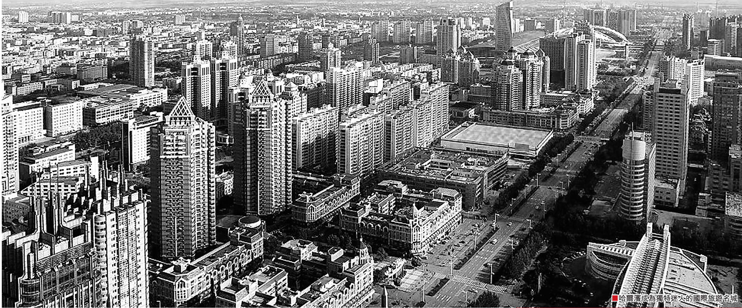
■哈爾濱成為獨特迷人的國際旅遊名城