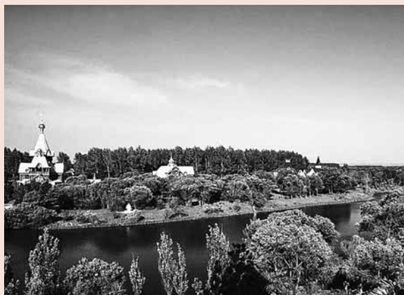
■哈爾濱重點旅遊項目——美麗的伏爾加莊園。

第27屆中國哈爾濱國際冰雪經濟貿易洽談會將於2011年1月5日至8日在哈爾濱國際會展體育中心舉行。本屆冰洽會共設國際標準展位1500個，展覽面積2.2萬平方米，規模較去年擴大1倍，將設立裝備製造、綠色及名優食品、生物工程及醫藥、輕工工藝、外省市重點企業、台灣精品展等九大展區。同時舉辦項目洽談簽約活動；對俄羅斯等國家的科技合作展活動；哈南工業新城宣傳推介活動；科技創新城宣傳推介活動；地區間交流與合作活動；高論壇等活動。