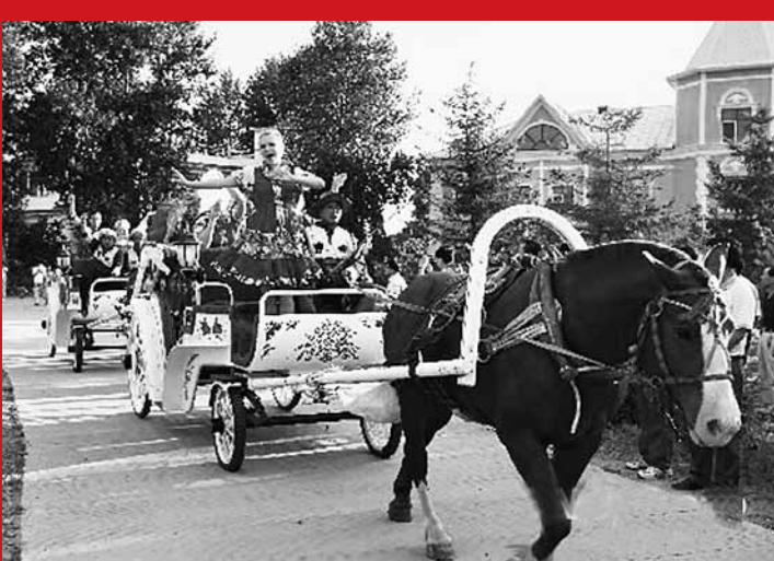
■森林音樂節——聽山聽水聽音樂。