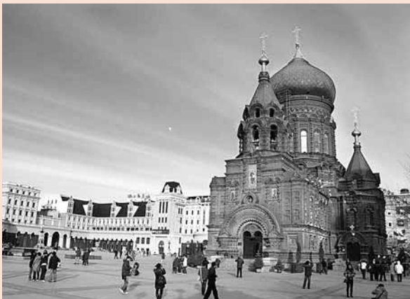
■聖·索菲亞大教堂是哈爾濱的標誌性建築

當今的旅遊業已進入科學發展的時代，應當更加重視旅遊的多功能特點，哈爾濱不斷挖掘歷史積澱形成的獨