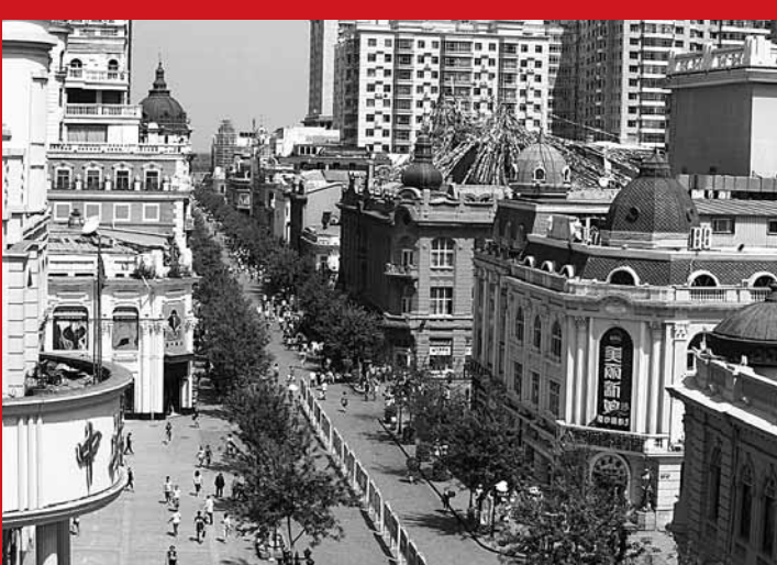
■亞洲最長最大的步行街中央大街盡展歐陸風情