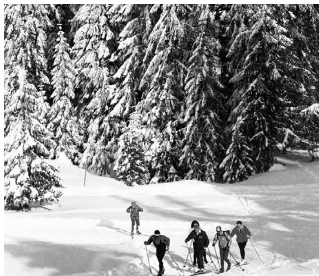
■哈爾濱已成為中國最大的滑雪勝地

43種語言向全球展示推介，31家境外媒體參與報道，500多萬境外網民投票。日前，「2010中國城市榜——全球網民推薦的中國旅遊城市」網絡評選活動揭曉，哈爾濱入選中國十大旅遊城市，並以最高票數位居榜首。「歐陸風情、冰城夏都」成為哈爾濱旅遊發展的最大「賣點」，而「城市即旅遊，旅遊即城市」的大旅遊發展戰略讓這座天鵬項下的明珠城，生機勃發，魅力一新。