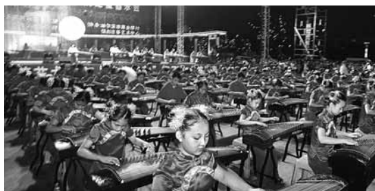
■哈夏音樂會——中國三大音樂節之一

作為北方邊陲重鎮的哈爾濱，因其氣候瀟灑，一度被譽為「東方小巴黎」、「北方莫斯科」。一曲《太陽島上》唱響了神州，讓國人乃至世界認識了哈爾濱，對這裡充滿了無限的嚮往。電影和評書《夜幕下的哈爾濱》為它平添了些許神祕色彩和英雄氣概。那千冰封、萬里雪飄的夢幻世界，不知讓多少遊人留連忘返，樂醉其中。從「中國版圖」到「天鵬項下的珍珠」，從「女真語阿勒頗」到「兩萬兩千多年歷史」，「冰城創造」記錄了眾多輝煌；哈爾濱冰雪藝術博覽會創制7項健力士紀錄；