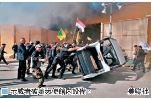
■美聯社/路透社/法新社

美國總統特朗普在twitter發文，指伊朗「策劃」針對美國駐巴格達大使館的襲擊，需負上所有責任，相信伊拉克會派員保護使館。伊拉克看守總理邁赫迪要求示威者立即離開大使館。 伊拉克數十名國會議員已呼籲政府，重新審視讓美軍駐守當地的協定，稱美軍空襲是侵犯主權，已令協定失去效力。親伊朗的伊拉克武裝分子前日表明會報復美軍空襲。華府則指責伊拉克未有保護美方境內利益。