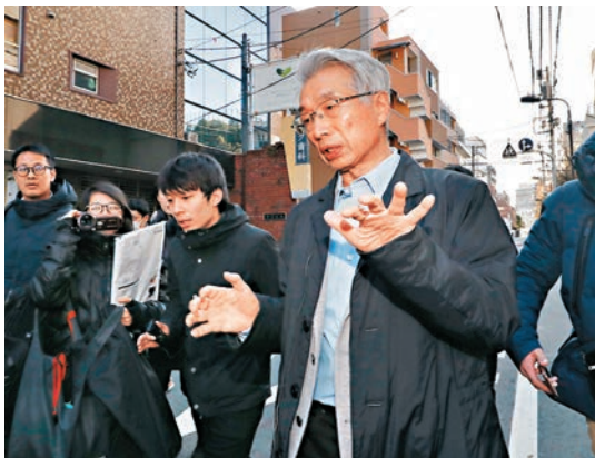
■弘中惇一郎強調對戈恩潛逃計劃不知情。

日本至今尚未與黎巴嫩達成引渡協議，意味即使日方提出引渡要求，只要黎巴嫩一方不同意，便難以令戈恩返回日本受審。如果日方確認戈恩違反保釋條件，將撤銷其保釋，並沒收他合共繳付的15億日圓(約1.08億港元)保釋金。 政府無戈恩離境記錄 戈恩保釋條件包括不得與妻子卡羅勒聯絡、其住所需限制於東京市中心、禁止出境、護照須交由律師保管，以及若在日本境內旅行超過3日，需獲法院許可。戈恩的住所入口也須裝置監控鏡頭，定期將錄影片段呈交法院，且只能使用由其律師提供無法上網的電話，同樣要把通話記錄呈交法院。