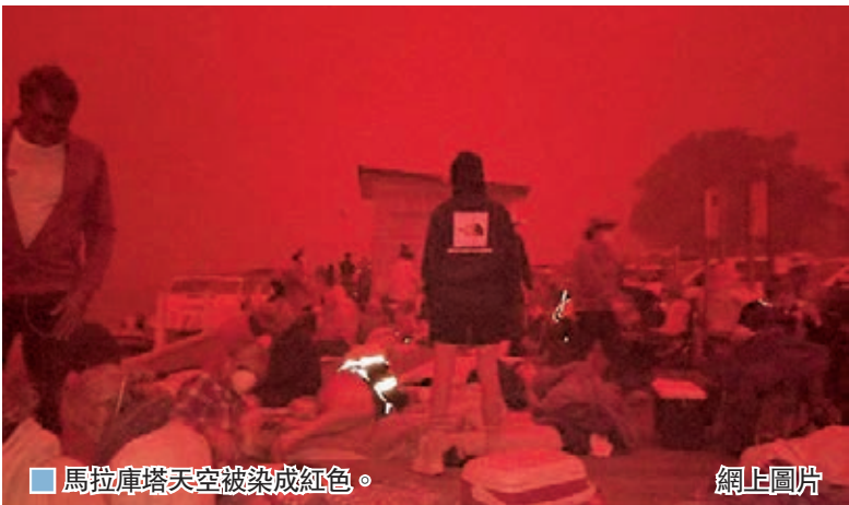
■馬拉庫塔鎮被濃煙籠罩。