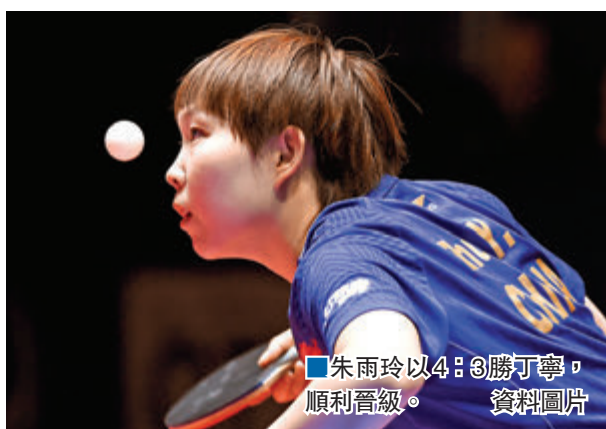
■朱雨玲以4:3勝丁寧,順利晉級。資料圖片