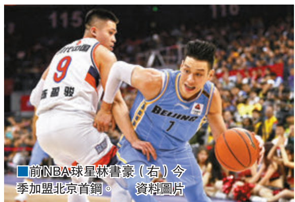
■前NBA球星林書豪(右)今季加盟北京首钢。