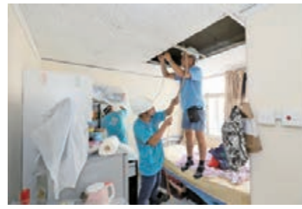
中電資助劊房單位業主重鋪電線，以便安裝獨立電錶。

縱然政府推出電費補貼措施，劊房戶卻因沒有獨立電力賬戶而未能受惠，故中電特別為劊房戶，提供相應支援，於2020年撥款700萬港元，為困難劊房住戶，提供每戶600元的電費資助，及支援劊房單位業主重鋪電線以便安裝獨立電錶。