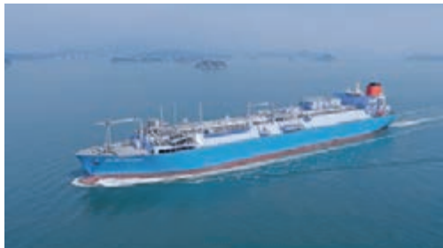
中電努力開拓新的天然氣源，確保長遠天然氣的供應穩定充足。

中電亦會透過建造新機組，增加燃氣發電。中電正於屯門龍鼓灘發電廠興建一台使用聯合循環