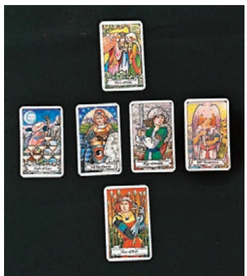
塔羅牌預測香港民生情況