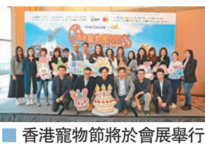
香港寵物節將於會展舉行

被譽為「寵物界大展會」的「香港寵物節2020暨國際寵物用品博覽」已踏入第十五屆，將於2月在香港會議展覽中心3號展覽廳舉行，今年規模更為歷屆最大，有超過500個展位及170個參展商，展銷來自世界各地逾1,000個品牌的寵物食品、用品及服務，更首次將展期擴至四天，讓主人及愛寵可有多一天時間入場購物玩樂。