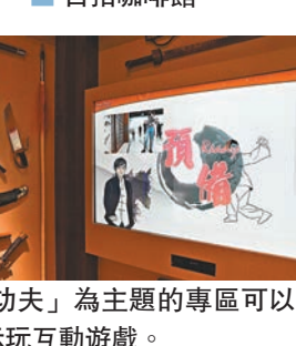
以「功夫」為主題的專區可以按照指示玩互動遊戲。