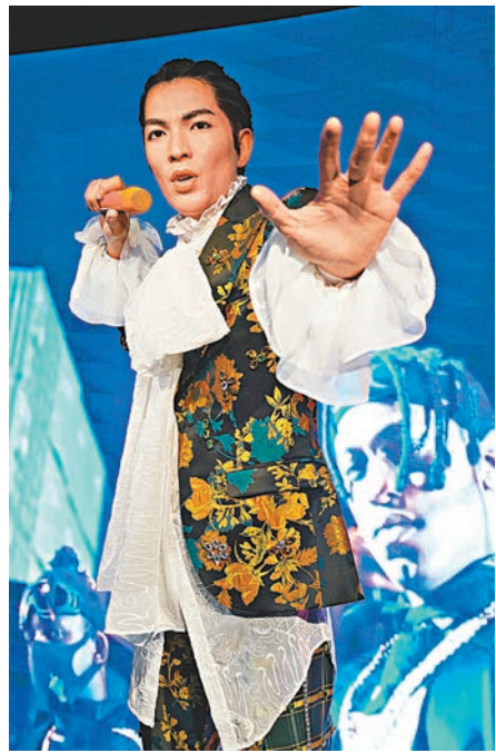
新入駐的蕭敬騰蠟像。