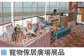
寵物傢居廣場展品

為慶祝寵物節15周年，大會將在2月8日舉行一場別開生面的「15歲生日會」，邀請今年同樣是15歲的寵物前來慶祝。今屆寵物節亦會推出四大優惠，只要香港身份證號碼包含1或5其中一個數字，便可於展期的首兩天免費入場。場內設有攤位遊戲，入場人士只要完成遊戲，即可獲得場內消費的優惠現金券，禮品總值港幣50萬元。而以信用卡簽賬消費滿HK$250即可參加大抽獎，贏取雙人日、韓、泰來回機票，今年更首次有順豐速遞駐場，以優惠價提供送貨上門服務。