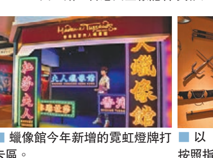
蠟像館今年新增的霓虹燈牌打卡區。