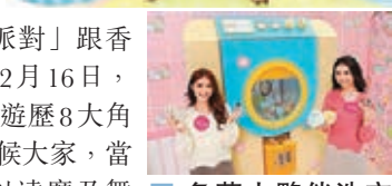
角落溫暖大廳 角落小夥伴洗衣獅香港獨家造型搶 Fo 亮相。加上，位於商場 L1 的「期間限定店」更特意於日本搜羅多款角落小夥伴的精品小物。

例如，在角落溫暖大廳裡，來到角落小夥伴的家，看到電視正播放白熊「Shirokuma」與雜草「Zassou」和粉圓「Tapioca」合作的舞獅表演，並別忘往上看，粉圓躲在屋頂煙囪的角落，跟你玩伏匿。同時，在角落小夥伴洗衣夾夾機裡，有一個神秘的爪常常把粉圓「Tapioca」夾起，現在你也有機會把躲在洗衣機角落裡的一眾角落小夥伴夾走！The ONE Club 會員只要憑200積分，即可免費換領洗衣夾夾機的遊戲券乙張，憑券可參與遊戲，有機會贏取角落小夥伴6吋或3吋公仔或人氣商戶茶墨S25現金券。