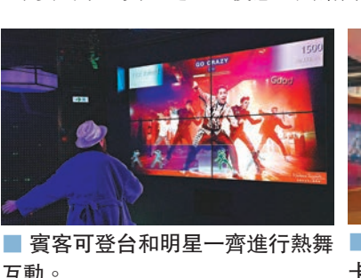
賓客可登台和明星一齊進行熱舞互動。

「巨星之旅」當然少不了與摯親好友齊齊分享，香港杜莎夫人蠟像館現正推出優惠同大家一起「型」接鼠年兼行好運。香港居民憑身份證便可以享受門票「買一送一」優惠，與館內