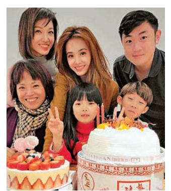
蔡依林(後排中)與姐姐一家感情要好。

蔡依林昨日在社交網晒出了幾張照片,並且配上文字祝福姐姐生日快樂,她感謝姐姐就像爸媽一樣照顧、教導她。更曝出姐姐與姐夫的愛情故事,原來當年姐姐和姐夫是在街上搭訕認識的,然後兩人就結婚了。蔡依林直言就像韓劇一樣,更稱他們相識時就是她出道時間,即是已經相識20年。