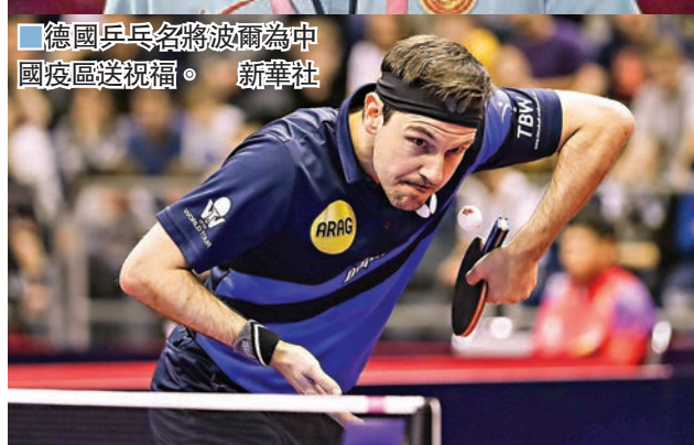
德國乒乓球名將波爾為中國疫區送祝福。