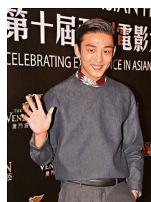
劉亞仁替武漢人民加油打氣。