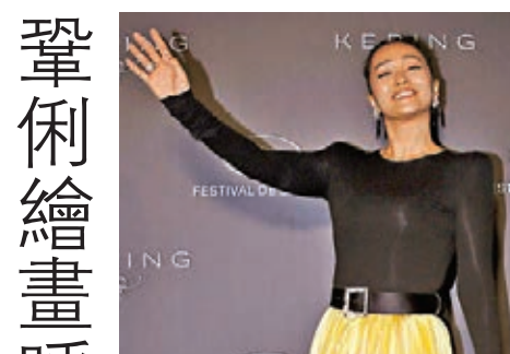
鞏俐呼籲大家要拒絕食野味。 資料圖片