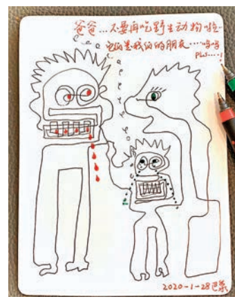
鞏俐這幅「不吃野生」是一筆畫。

此外,韓紅昔日接受訪問的視頻亦重新被網民熱搜,在訪問中韓紅表示做慈善最大的經驗就是親手送錢給受助者,最大的教訓就是任何組織做不到乾淨就活該被社會質疑。