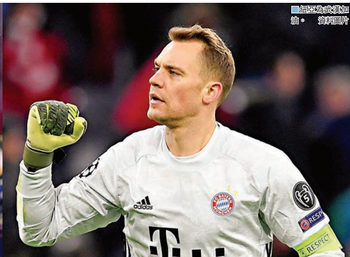
紐亞為武漢加油。 資料圖片