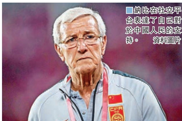
納比在社交平台表達了自己對於中國人民的支持。 資料圖片