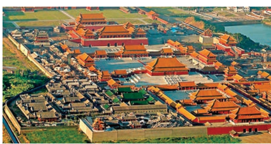
橫店影視城規模甚大。

為配合防疫,著名古裝拍片景點橫店影視城早前已宣佈暫停開放了劇組拍攝,停拍無了期待深深影響着劇組,影視業界受到重重打擊。橫店影視城昨日發佈公告,稱為了盡量減少各劇組和演員的損失,影城在劇組停拍期間,其拍攝基地、攝影棚費用全免,劇組在影視城旗下各酒店的費用減半。此外,橫店的演員公會亦會在停拍期間,對群演和普通群演每人提供一個月的300元租房補貼和200元生活補貼,一起共渡難關。