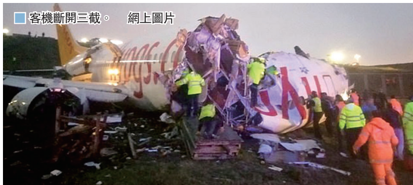
客機斷開三截。

土耳其傳媒報導，土耳其飛馬航空一架波音737客機昨日在伊斯坦布爾的薩比哈·格克琴機場降落期間滑出跑道，在一條道路上撞毀，機身斷成三截並起火，救援人員到場後撲滅火勢，並救出機上乘客，土耳其運輸部長表示，機上共有177名乘客，事故中無人死亡。