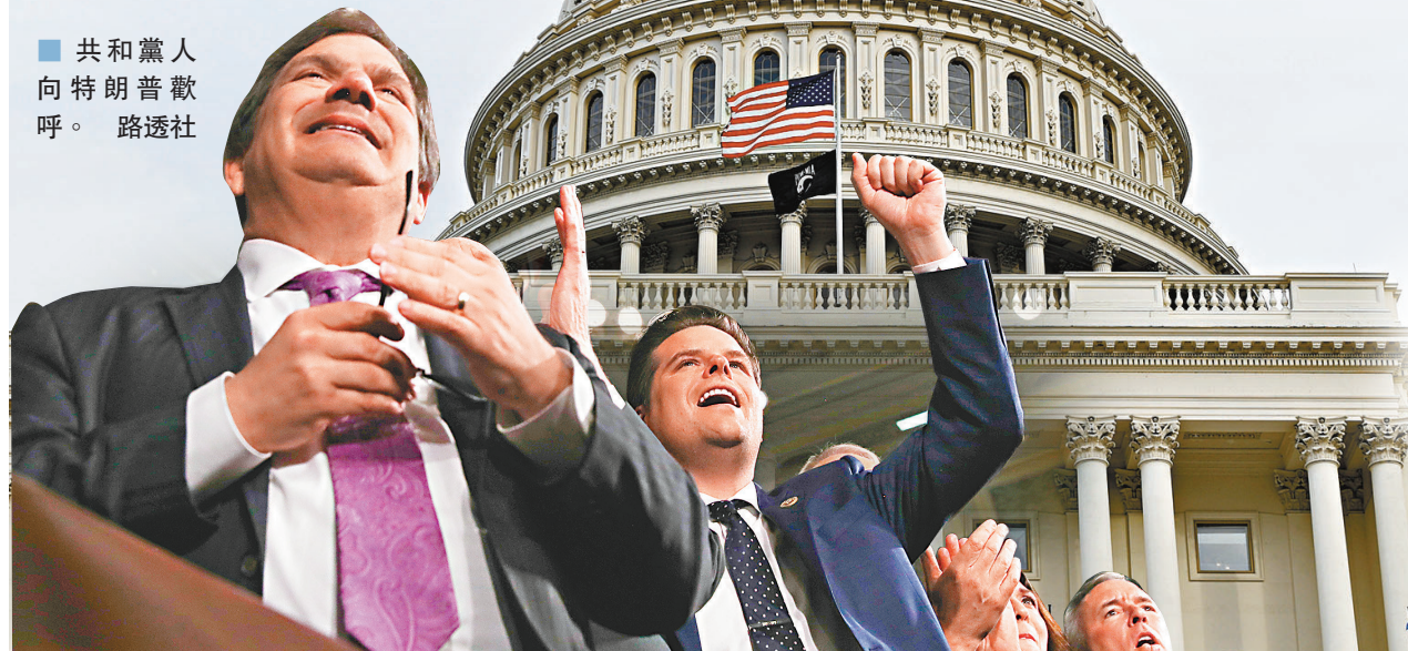
共和黨人向特朗普歡呼。