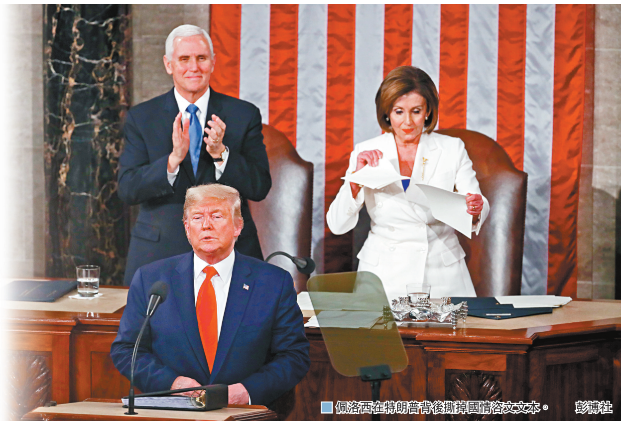
佩洛西在特朗普背後撕掉國情咨文文本。