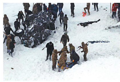
大批人員在搜救期間被雪活埋。

土耳其東部凡省巴薩奇薩賴縣前日發生雪崩，當局派出大批搜救人員到場搜索失蹤者，豈料昨日再次出現雪崩，導致許多人員被活埋，當局證實