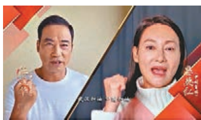
任達華與惠英紅齊聲發聲。