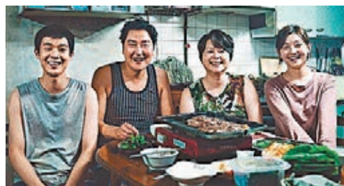
《上流寄生族》無法乘奧斯卡威勢即時於內地放映。

據外媒 THR 報道，由於新冠肺炎疫情影響，2020 年全球票房或損失逾 10 億美元。