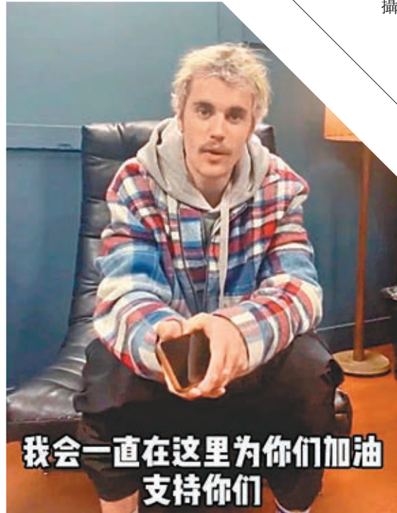
我會一直在这里為你們加油支持你們