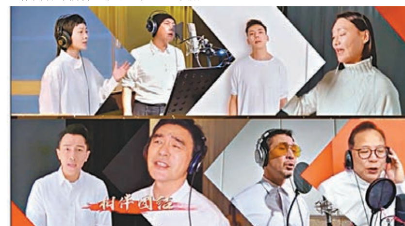
群星同心抗疫，高唱《堅信愛會贏》。網絡截圖

給 2020 身處疫區前線的人們，中國有難一起扛。今次導演組挑選這首歌曲，是因為覺得這首歌曲體現了人間大愛，體現了愛能超越一切，體現了所有人攜手共渡難關的信心和決心。