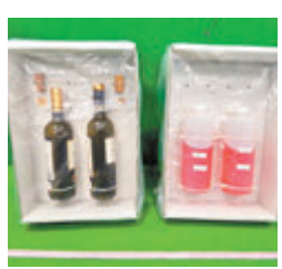
海關檢獲的懷疑液態可卡因（右）藏在兩個酒樽內（左）。

香港文匯報訊（記者 蕭景源）機場海關人員揀選來自高風險地區的旅客作清關檢查，確有效打擊跨境販毒活動。根據《危險藥物條例》，販運危險藥物屬嚴重罪行，一經定罪，最高可被判罰款500萬元及終身監禁。市民可致電海關24小時熱線25456182，或透過專用舉報罪案電郵帳戶（crimereport@customs.gov.hk）舉報懷疑販毒活動。