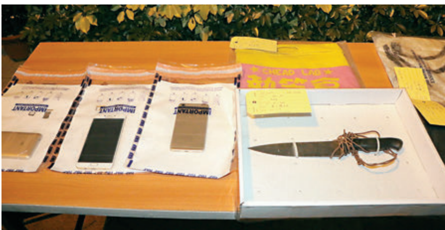
警方在偵破便利店劫案記者會上展示檢獲的證物。

便利店劫案昨再添兩宗，凌晨3時許，尖沙咀麼地63號好時中心地下一間便利店，突被一名年約30餘歲、戴黑帽及口罩的男子闖進，亮出20厘米長生果刀，指嚇店內一名56歲女職員，掠走