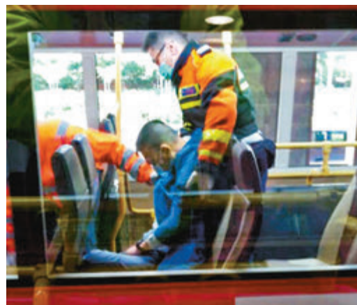
男子昏迷巴士車廂送院證實不治。網上圖片

上週五（14日）午夜零時許，在洪水橋石埗村，兩名男子將一輛偷來的私家車倒後撞毀一間村屋的大閘後，再棄車並放火燒車逃去。警方則在前晚（16日）於深圳灣管制站拘捕被告，以涉嫌自稱三合會成員、刑事恐嚇、刑事毀壞、行使虛假文書、縱火及擅自取去交通工具罪名將他帶署通宵扣查。