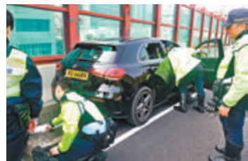
呈祥道失事私家車司機昏迷送院證實不治。

香港文匯報訊（記者 蕭景源）一名任職地盤管工的中年男子，昨午駕私家車沿長沙灣呈祥道駛經愛醫院對開時，疑突然病發致昏迷失去知覺，私家車頓在無人駕駛下失控，撞向高速公路兩邊石壁，再鏟上慢線石壁始停下，消防員到場擊碎玻璃窗救出事主送院，惜證實不治，警方事後經調查相信無可疑。