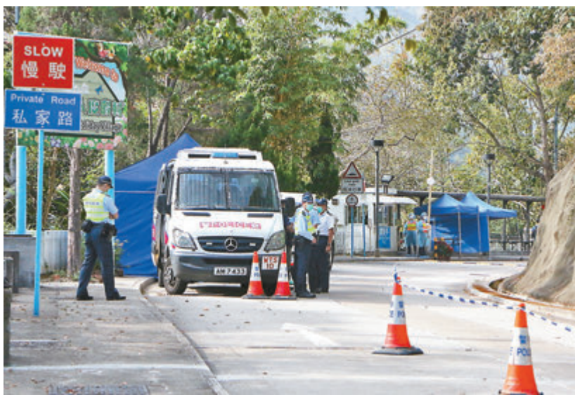
林志偉批評香港電台，在目前疫情緊張的形勢下，用毫無事實根據的指控詆毀及侮辱一班站在前線，積極協助抗疫的警務人員。圖為隔離營外站崗的警員。

林志偉指郭家麒亦維持一貫惟恐天下不亂的作風，在網絡平台上以片面的數據及失實的指控，誣毀警隊及濫用防疫裝備，又公然詆毀警察為「黑警」及「貪生怕死」，煽動仇