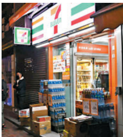
麼地道便利店凌晨遭獨行賊打劫後繼續營業。

香港文匯報訊（記者 蕭景源）便利店劫案頻生，昨於尖沙咀及灣仔先後再有便利店遇劫，其中一店損失630元現金及兩包香煙，另一間則幸保不失。連同昨兩案，11天內港九新界已至少有8間便利店被劫。元朗警方先後拘捕兩名男子，至少涉及上週三（12日）行劫元朗教育路便利店，正追查兩人有否涉及其他同類劫案。