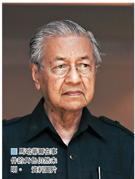
馬哈蒂爾在事件的角色仍然未明。

這場大馬近年最激烈權鬥劇，由土團於昨日下午2時退出希盟揭開序幕，不足半小時後，總理辦公室公佈馬哈蒂爾已向國家元首提交辭呈，同時辭去土團的名譽主席。同一時間，安華領導的人民公正黨內，署理主席阿茲敏宣佈帶領其餘10名議員退黨，包括4名部長、副部長及下議院副議長等高層人物。