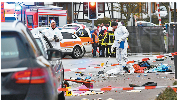
警察與救護人員到場。

馬來西亞爆出政壇大地震，總理馬哈蒂爾昨日下午突然宣佈辭去總理及土著團結黨主席一職，執政不足兩年的希望聯盟，亦因為多名議員變節而倒台。據報今次事件是由希盟內部權鬥引發，支持馬哈蒂爾的派系不欲讓前副總理安華接班，於是陰謀聯同巫統等在野黨派另組政府，馬哈蒂爾拒絕合作，於是決定「雙辭」。安華與馬哈蒂爾會面後，亦表示相信對方的說法，但同時承認希盟已經沒有足夠議席組成新政府。大馬國家元首昨晚任命馬哈蒂爾暫任過渡總理。