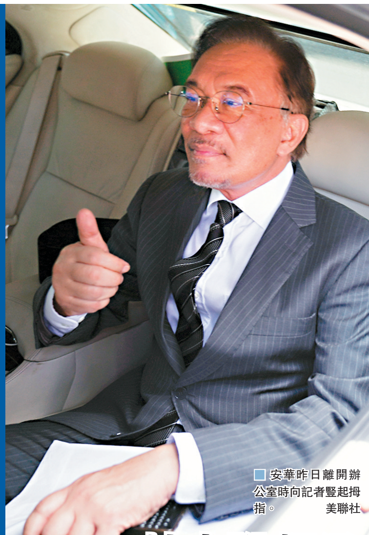
安華昨日離開辦公室時向記者豎起中指。