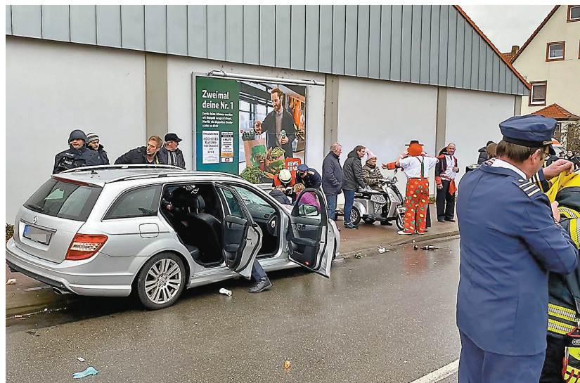
事件造成多人受傷。