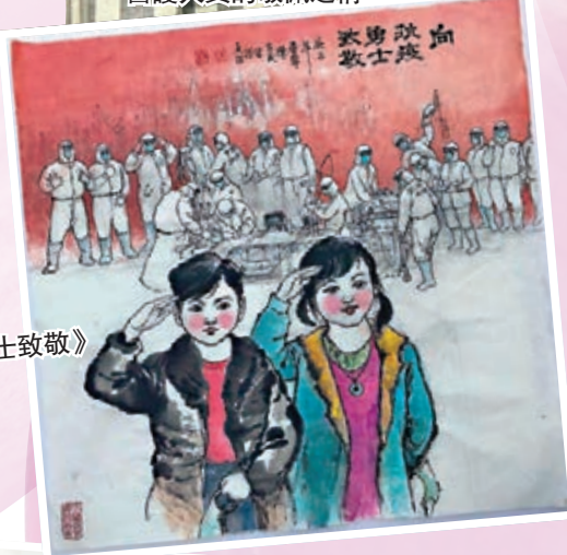
陳家義《向抗疫勇士致敬》