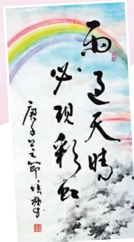
吳培疆書法作品以彩虹顏色做背景。