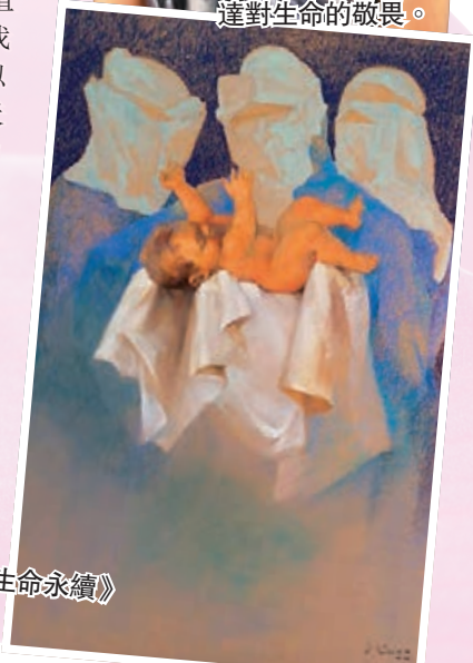
廖井梅《守護天使——生命永續》