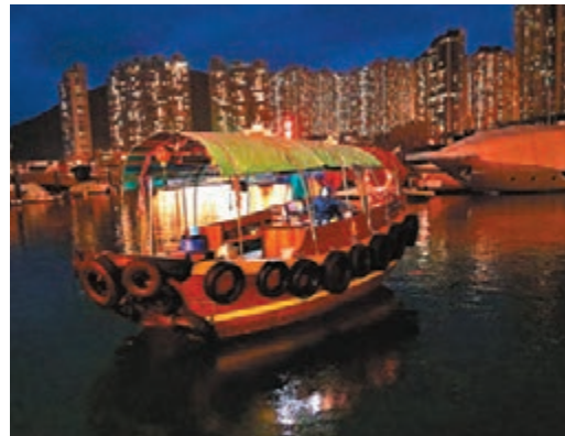
香港仔避風塘的舫船。