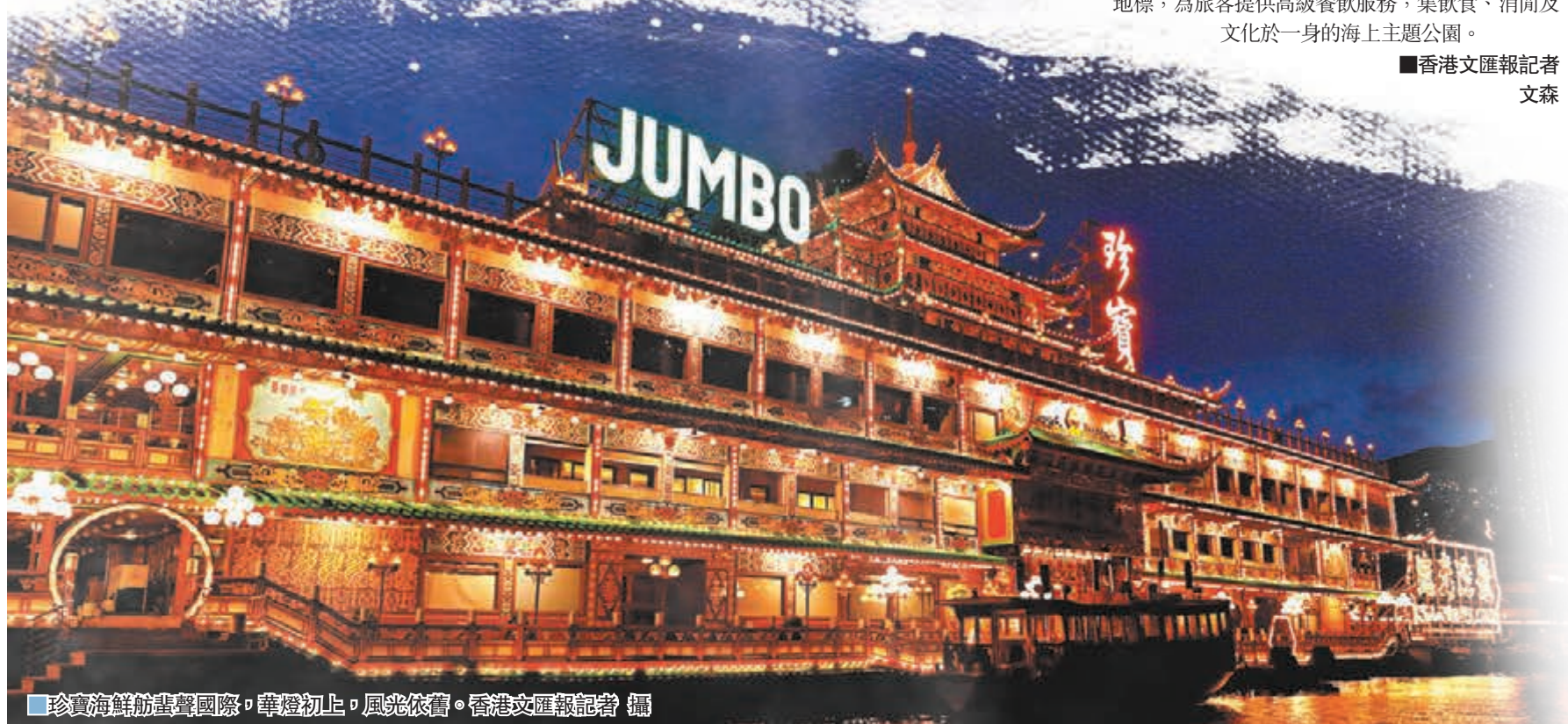
珍寶海鮮舫蜚聲國際，華燈初上，風光依舊。