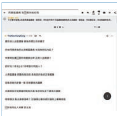
▲連登仔「TheNewHongKong」發帖，向西貢泛暴派議員連環開炮。網上圖片