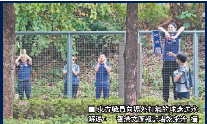
東方職員向場外打氣的球迷送水解渴。