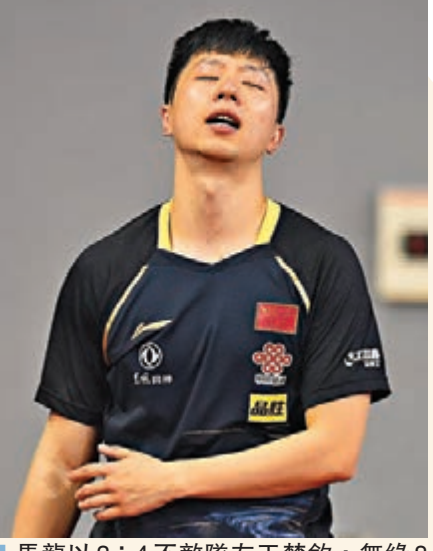
馬龍以3:4不敵隊友王楚欽，無緣8強。

國際乒聯白金級巡迴賽——卡塔爾公開賽香港時間7日晨結束了男單8強席位的爭奪。國乒名將樊振東、許昕均以4:0戰勝各自對手，王楚欽則以4:3險勝隊友、大滿貫得主馬龍。 當天國乒上演了兩場「隊內戰」，樊振東以4:0輕鬆戰勝隊友徐晨皓。王楚欽則與馬龍鏖戰七局，馬龍先是以15:13拿下首局，王楚欽以14:12扳回一局；第三局和第五局馬龍以11:4、11:3迅速拿下，王楚欽則在第四局和第六局打出11:8和13:11，決勝局又以11:6獲勝，從而險勝馬龍晉級八強。 王楚欽賽後說，首局自己有很多機會，但很久已經沒有打出這種高強度對抗性比賽，快到賽點時有些慌。王楚欽此前遭遇禁賽，回歸賽場的他表示，自己是一個從零開始的人，需要一場場去拚，渴望每一場比賽勝利。