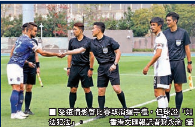
受疫情影響比賽取消握手禮，但球證「知法犯法」。