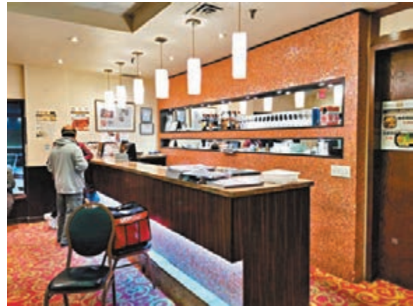
▲ 食肆門庭冷清。