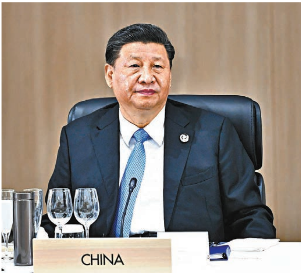
▲習近平今日將出席G20應對疫情視頻峰會。圖為習近平去年出席G20峰會。

古特雷斯呼籲G20領導人緊急發起一個總額達數萬億美元的刺激計劃，把疫情所造成的經濟社會衝擊降低到最低限度。他說，到今年年底，新冠疫情造成的損失將以萬億美元計。G20必須作出相應反應，向經濟體注入大量資源。當前局勢前所未有，常規的經濟規則和經濟政策工具不再適用。與2008年金融危機不同，此次危機不僅需要保障金融機構的流動性，還應該關注家庭、低收入者、中小企業等的需求。