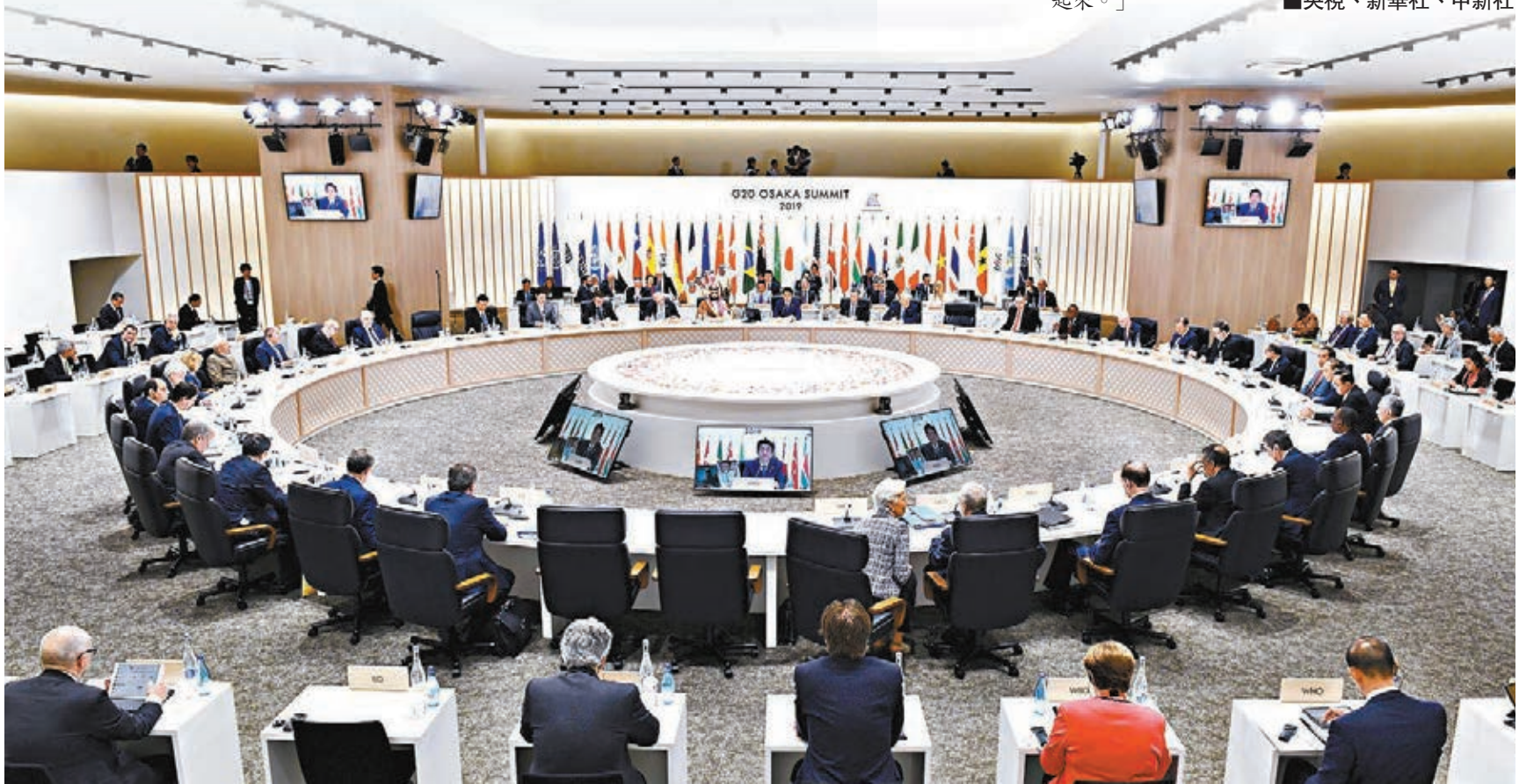
▲此次G20峰會為歷史上首次通過視頻舉行。圖為去年G20峰會現場。 資料圖片

多國家累計確診人數已上萬，G20國家累計確診人數佔全球確診人數80%以上。根據新華社的盤點統計，除中國外，意大利、美國、西班牙、德國、法國確診病例均已超過2萬，英國亦有超過八千宗確診病例。