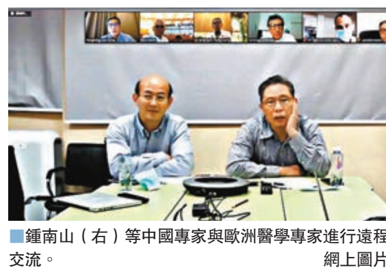
▲鍾南山(右)等中國專家與歐洲醫學專家進行遠程網上圖片

有較高的傳染性和高死亡率、無症狀病毒攜帶者也具有傳染性、早期病人具有更高的傳染性、需要保持下水道通暢等。