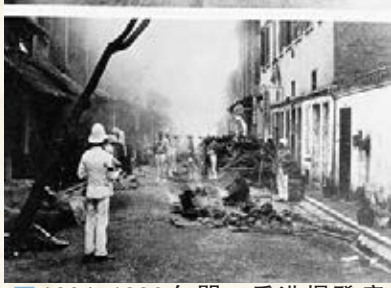
1894—1896年間，香港爆發瘟疫、疫症。上圖為病者在堅尼地城一間臨時醫院接受治療，下圖為太平山街景，檢疫隊將受感染住戶的傢具雜物焚燒。