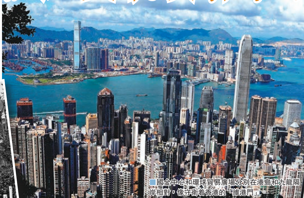
國金中心和環球貿易廣場分別在港島和九龍隔岸相對，像守衛着香港的「維港門」。

據香港大牌地產經紀透露，中國人真正大批進軍太平山山頂豪宅區，還是在內地改革開放以後。內地改革開放，大