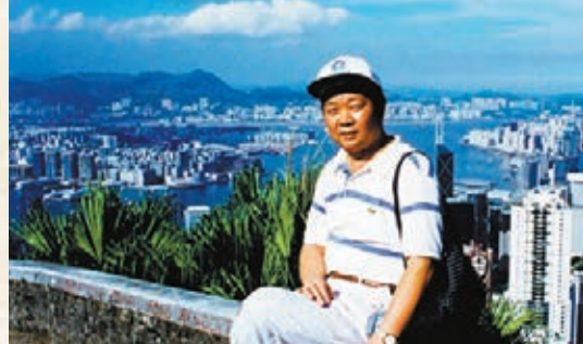
作者於2007年在太平山拍照留念。