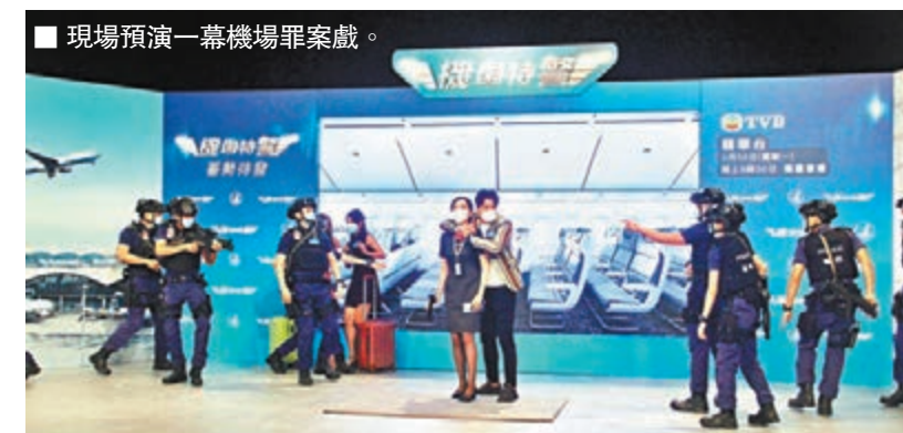
現場預演一幕機場罪案戲。