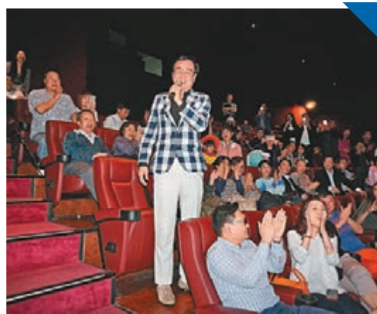
黃百鳴旗下戲院於今日下午6時停業前,已排的电影會如期播放。

暫停營業14天。在此希望香港共同抗疫成功,戲院業繼續為觀眾提供優質的觀眾感受。」 Cinema City 院線老闆黃百鳴旗下5間戲院於今日下午6時停業前,已排的电影會如期上映,但原定紀念張國榮於4月1日上映的《白髮魔女傳》及4月8日上映的《夜半歌聲》4K修復版,將會待戲院重開後再作安排。 高先電影公司則回應:「非常贊成戲院暫時關閉,因為現在票房好低,但員工仍然要照常返工,對觀眾同員工都有危險。至於我們排咗嘅片,等戲院開返可以陸續安排返上映,有問題的,全城合作抗疫,健康最重要!」