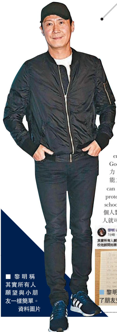
黎明稱其實所有人願望與小朋友一樣簡單。

黎明(Leon)昨日在社交網分享了朋友兒子的家課,並在帖文留言:「其實所有人願望與小朋友一樣簡單,我朋友個仔的家課卷回應『學校老師問如果你有superpower(超能力)…你想要乜?』」 Leon在帖文上載朋友孩子的家課,從中可見小朋友寫了一段說話,並畫了一幅畫。「If I could have any superpower. I will have healing power like God. (如果我能擁有一種超能力,我會想擁有如天神般治癒別人的能力。)」該名小朋友又指,「I can make everyone a heal shield for protection so everyone can go to school and back to work. (我可以為每個人製造一個治療盾作保護,那樣所有人就可以如常上學和上班了)」,並指