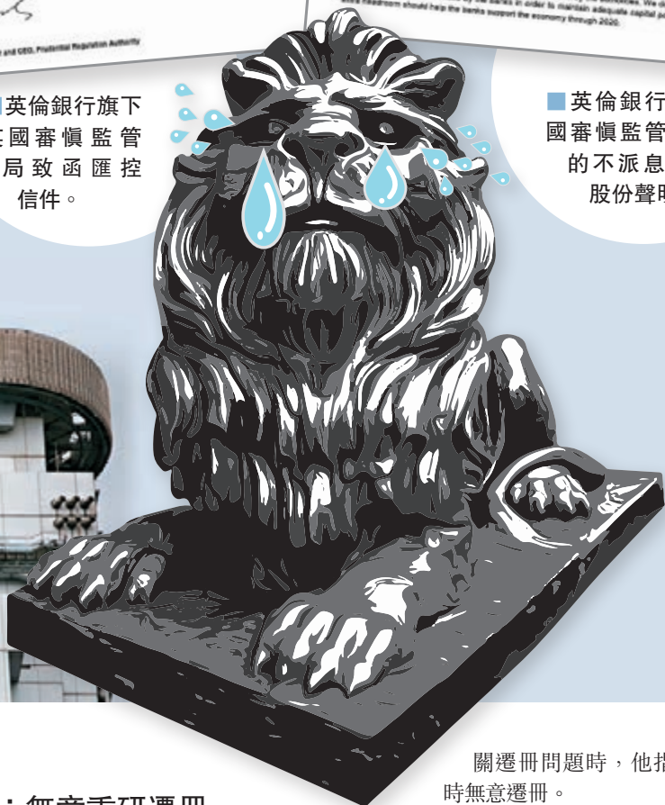
關遷冊問題時，他指集團現時無意遷冊。