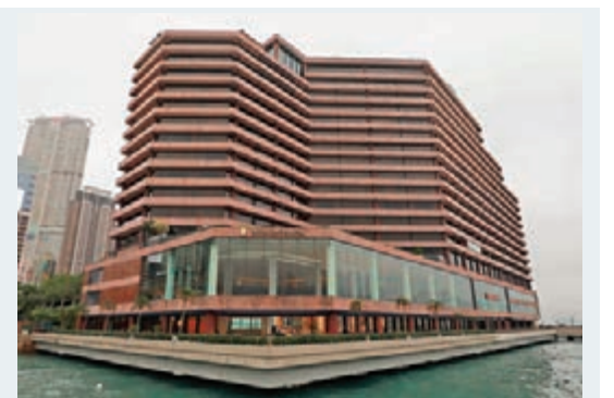
尖沙咀香港洲際酒店將要進行大裝修，大部分員工將被遣散。

2015年7月洲際酒店集團再以9.38億美元(近73億港元)沽出業權，新買家為基匯資本及建生國際，以成交價計算，平均每間客房約1,447萬元，成交總額及房價均創全港酒店買賣紀錄。洲際酒店集團出售後仍保留該