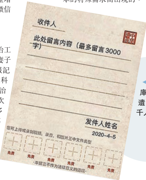
中華遺囑庫開通「微信遺囑」功能,近千人體驗。

值得一提的是,在「微信遺囑」頁面,亦有提醒:本留言不作為法律意義的遺囑。內地法律學者向香港文匯報表示,目前,法律上並沒有「網絡遺囑」這種遺囑方式,這種遺囑通常被認為是對家人的囑託和寄語,沒有實際法律效力。事實上,中華遺囑庫推出的「微信遺囑」服務實際是一種「情感遺囑」,是基於疫情時期民眾的特殊需求而出現的。