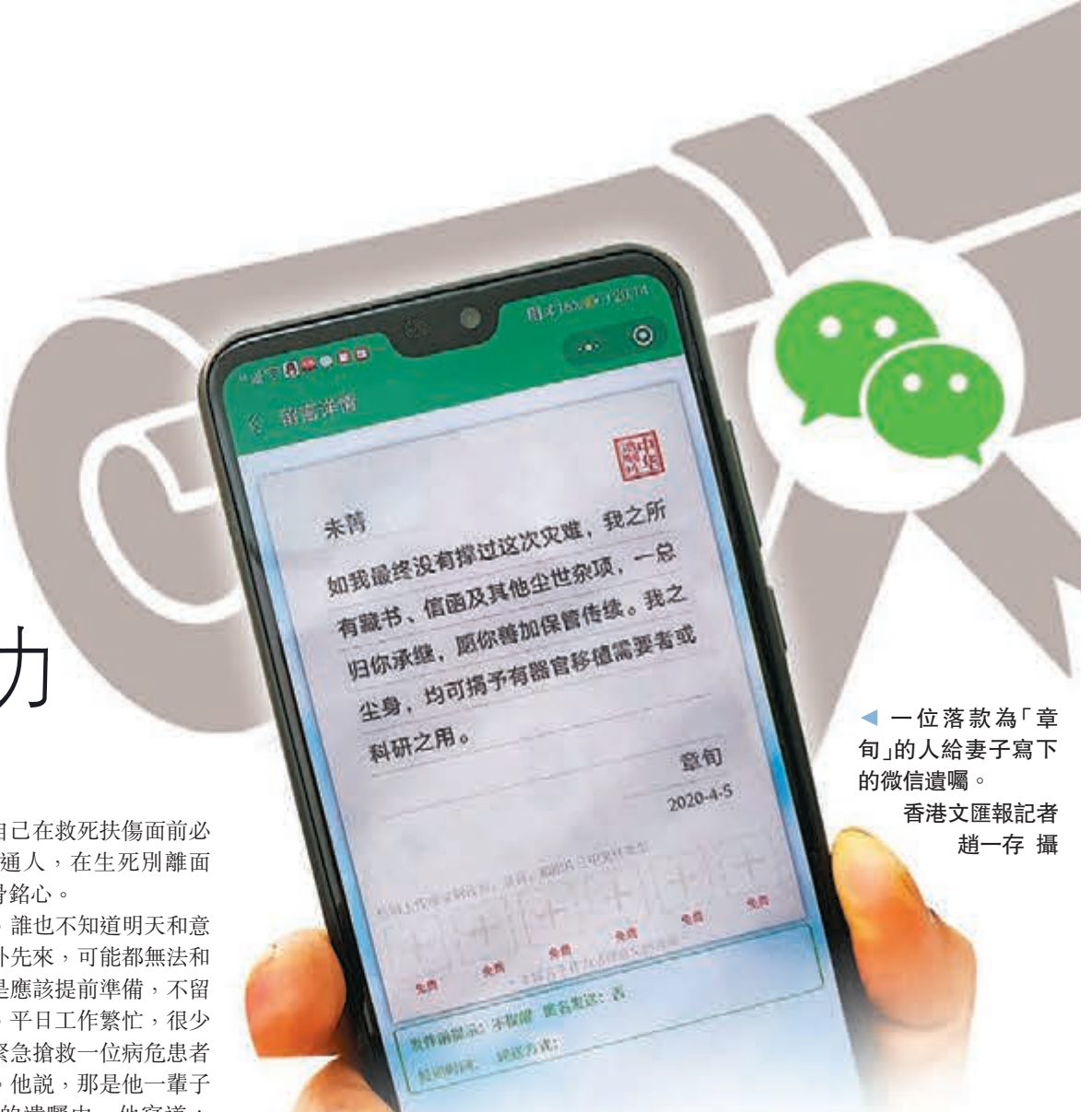
一位落款為「章旬」的人給妻子寫下的微信遺囑。