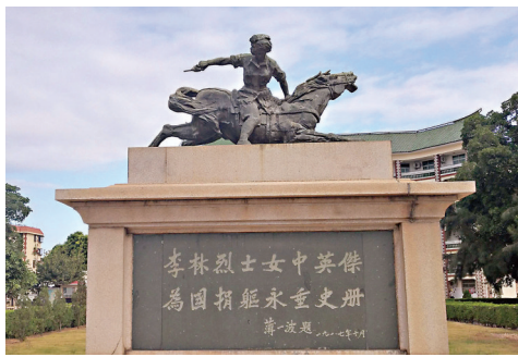
李林園中的李林塑像。

飄散着百年書香的集美中學，是李林的初中母校，也是她回國後第一個正式接受教育的地方。集美學校畢業後，李林在杭州女中學習了一年。在杭州，李林多次走近岳飛、敬慕秋瑾。她不但十分傾慕女俠秋瑾「好將十萬頭顱血，一洗腥膻祖國塵」的英雄情懷，而且專門定製了一套「秋瑾裝」。一年後，李林決定轉學到上海愛國女中。在學校裡，李林將閱讀範圍由文藝拓展到社會科學和哲學。當時上海四馬路的雜誌公司，成了她每周必到之地，潛移