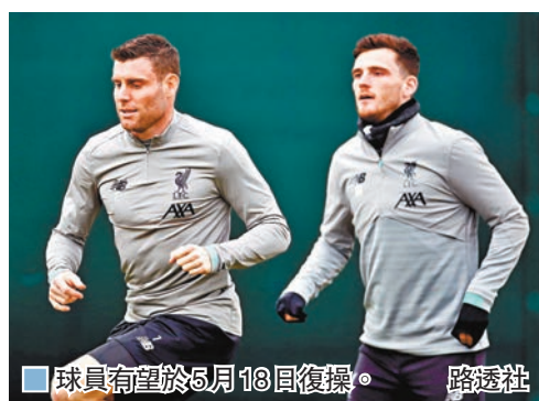
球員有望於5月18日復操。

香港文匯報訊（記者 楊浩然）英超20支球會於日前召開視像會議，席間除表明仍會盡力完成本賽季外，還定下了復操及復賽時間表。據英國傳媒報道，一眾英超球會希望在5月18日復操，並於6月8日起以閉門作賽方式完成餘下比賽，且看其如意算盤能否最終打響。