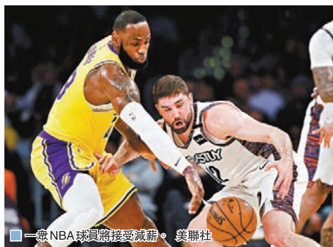
一眾NBA球員將接受減薪。