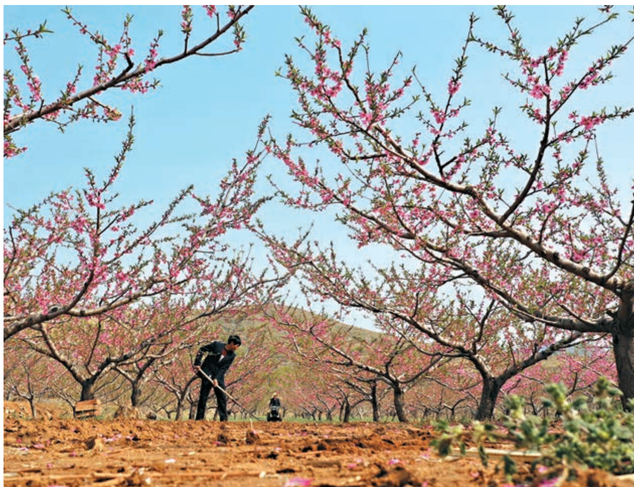
■穀雨已至，河北唐山的農民搶抓農時，開始進行春耕春播和加強田園作物管理。圖為4月18日唐山市豐潤區王官營鎮下水路村農民在桃樹園內鬆土除草（無人機照片）。

國家衛生健康委新聞發言人米鋒介紹最新疫情情況稱，4月18日，境外輸入新增確診病例一個月以來首次降至10例以下，但個別省份境外輸入引起的本土聚集性病例持續增加，提示要始終做好「篩查-診斷-報告-隔離」閉環管理，堅決防止社區傳播。