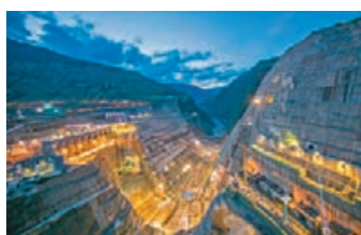
■白鶴灘水電站水墊塘採用反拱型底板複式梯形斷面設計。網上圖片

白鶴灘水電站位於四川省寧南縣和雲南省巧家縣境內的金沙江幹流下游河段，總裝機規模達1,600萬千瓦，建成後將成為僅次於三峽工程的世界第二大水電站。