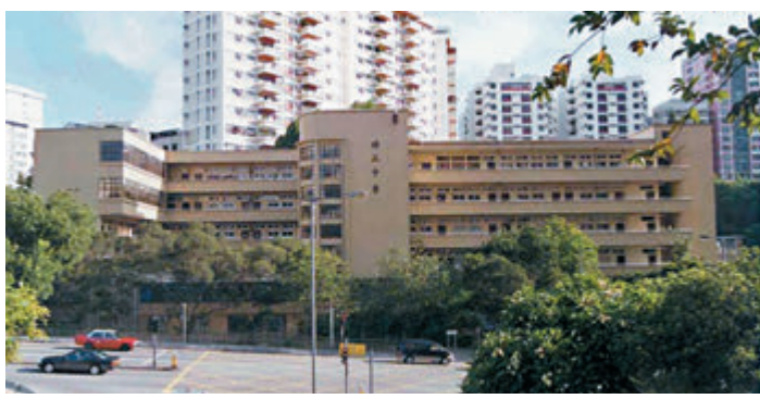
培正中學是其中一個被黑暴虛報有炸彈的試場。

警方強調,虛報炸彈是嚴重罪行,根據公安條例第二十八條,任何人觸犯炸彈嚇詐行為的罪行,一經循公訴程序被定罪,可被判處罰款15萬元及監禁5年。