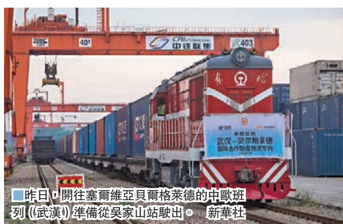
■昨日，開往塞爾維亞貝爾格萊德的中歐班列（武漢）準備從吳家山站駛出。

「中歐班列（武漢）首趟防疫物資專列的開啟，標誌着隨着疫情防控形勢持續好轉和經濟社會發展秩序加快恢復，疫情防