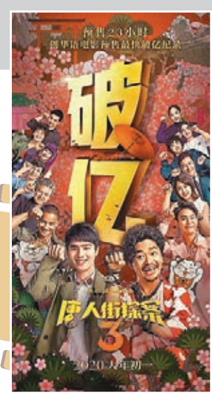
《唐人街探案3》也無奈撤檔。

同時，因疫情而造成的諸多影片積壓也導致未來電影上映和票房充滿不確定性。「可以預期，疫情過後上映時會面臨更大的競爭，稀釋所有影片的票房利潤。部分電影也許會為了保證投資回收而選擇線上播出。總之，中國乃至世界電影市場都會迎來更為嚴苛的優勝劣汰過程。」