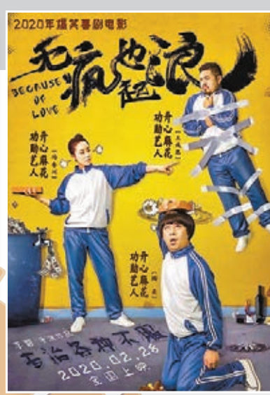
原定2月28日上映的《無瘋也起浪》劇照。