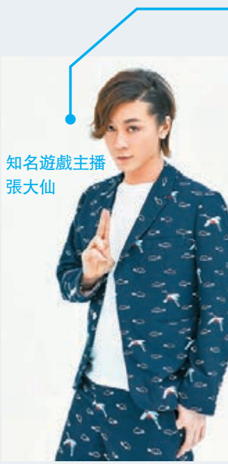
知名遊戲主播張大仙