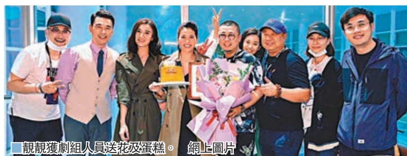
親親獲劇組人員送花及蛋糕。