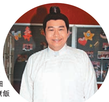
何遠東大讚細粒為人好，懂得煮飯尤其精於煲花膠鮑魚。