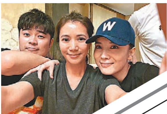
親親(中)自信十足，不介意近距離自拍。