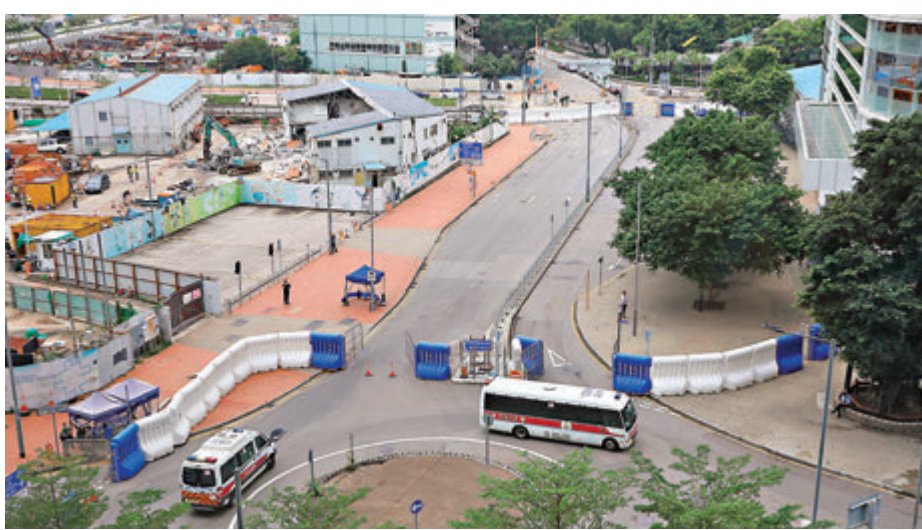
昨日警方在政府總部及立法會大樓對開一帶設置大量水馬，不時有警車巡邏。

自由黨副主席邵家輝表示，任何國家的國民都不會反對自己的國歌，攬炒派竟公然反對國歌法，不但令人莫名其妙，其所為實質上更是在反對基本法，可能已違反了立法會議員宣誓內容。