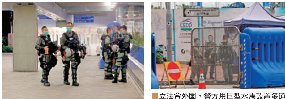
全副裝備警員巡邏。