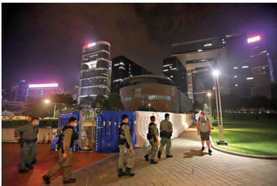
昨夜，立法會周圍全副裝備的警員巡邏，偶然有人經過。

攬炒派連日在網上大肆煽動今日包圍立法會，及發動「黎明行動」堵路、塞隧道及在港鐵沿線干擾列車，甚至「見路就封，完全癱瘓」，阻止立法會議員進入立法會大樓，及強迫市民參與「三罷」，近日在校園內更流傳組織學生罷課配合黑暴分子包圍立法會的行動，有煽暴文宣更狂言「衝入警署搶軍火」。【民主派會議】召集人陳淑莊昨日聲言，將「義無反顧」反對國歌法，但拒絕透露他們的部署。