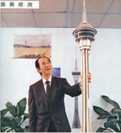
■ 1999年何鴻燊和澳門觀光塔模型。 資料圖片

——代賭王何鴻燊，自2009年7月跌入院後，身體漸出現各種健康問題，需經常出入醫院，近年更需留在養和醫院休養，去年更傳他曾在洗腎後一度心跳停頓而需搶救。近日，何鴻燊病況急轉直下，處於瀕留狀態，延至昨日中午1時去世。