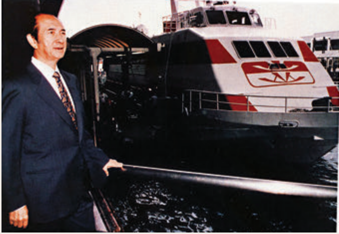
■ 1994年何鴻燊在新船北星號下水儀式上。

人稱「賭王」的信德集團創辦人何鴻燊，昨日中午1時在香港養和醫院安詳辭世，享年98歲。何鴻燊二房長女何超瓊宣布死訊時表示，家人雖然知道這一天終會來臨，但無減他們的悲傷，家人已有共識集體處理何鴻燊後事，詳情稍後公布。何鴻燊一生愛國愛港愛澳，生前曾出任全國政協常委、香港特別行政區基本法諮詢委員會委員、澳門特別行政區籌備委員會副主任委員，以及澳門特別行政區基本法起草委員會副主任委員，見證港澳回歸祖國的歷史時刻，並為報效國家出錢出力。各界對他的辭世深切哀悼。 ■香港文匯報記者 文森、費小嫻