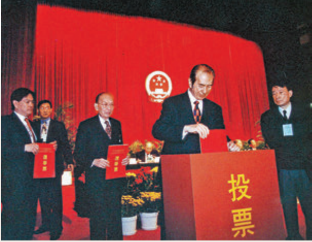
■ 1997年，何鴻燊為香港臨立會選舉投票。