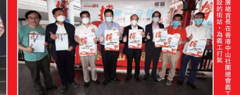
▲廣總首長在香港中山社團總會義工擺設的街站，為義工打氣