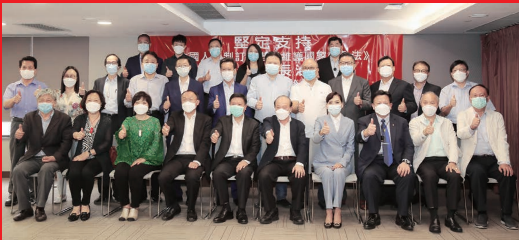
▲廣總在會所舉辦全國「兩會」分享會，宣傳港區國安法