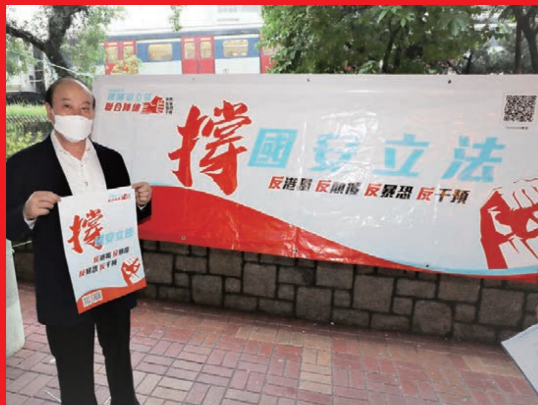
▲全國政協委員、廣總主席龔俊龍身體力行撐港區國安法

2020全國「兩會」於5月28日圓滿閉幕，為響應全國政協主席汪洋在會議中要求政協委員要做好凝聚共識工作，強化政治責任和使命擔當，香港廣東社團總會（下稱廣總）一連兩日，分別於5月29日舉辦全國「兩會」分享會，宣傳港區國安法；5月30日，廣總首長再馬不停蹄，由全國政協委員、廣總主席龔俊龍，全國政協委員、廣總第一執行主席鄧清河，廣州市政協常委、廣總執行主席黃俊龍，全國政協委員、廣總常務副主席兼秘書長龍子明，以及廣總有關首長，冒著大雨，前往新界、九龍、港島各區，巡視多個撐港區國安法街站，慰問街站義工，為義工打氣。龔俊龍坦言，從去年以來，市民深受「港獨」、「黑暴」之苦，營商、就業、生活，甚至是個人最基本的生命安全都沒有切實保障，因此，中央英明出手，徹底堵塞香港國安漏洞，是得民心順民意，確保「一國兩制」沿著正確的軌道行穩致遠。