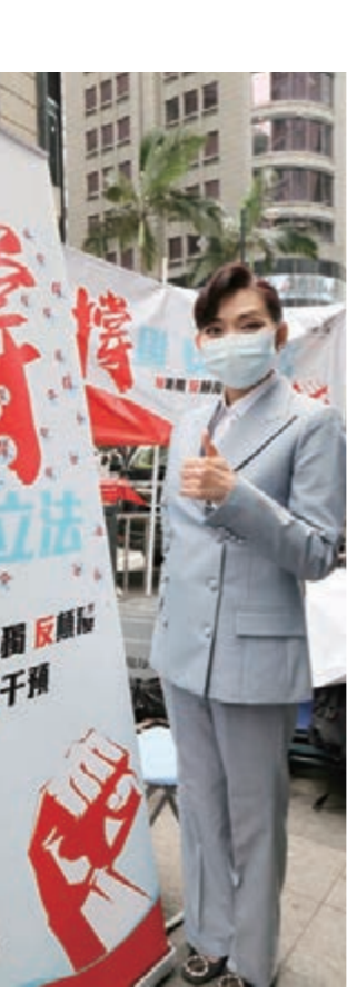
▲廣總常務副主席鄺美雲簽名支持，宣傳港區國安法