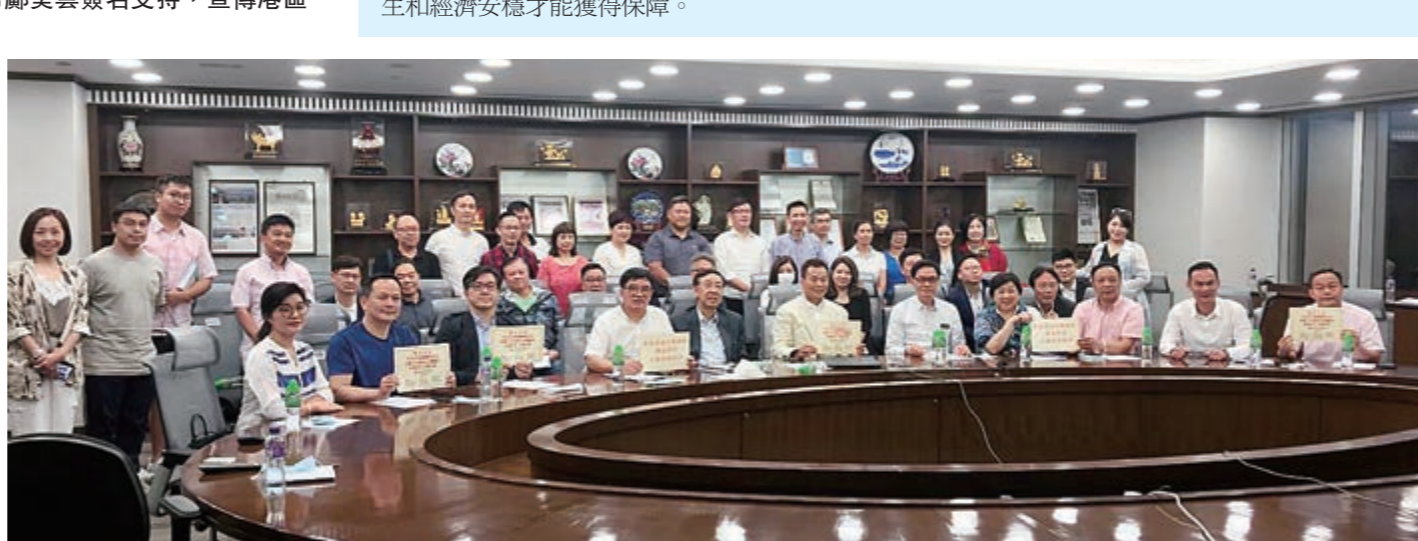
▲5月29日，香港清遠社團總會會所舉行全國「兩會」精神分享會