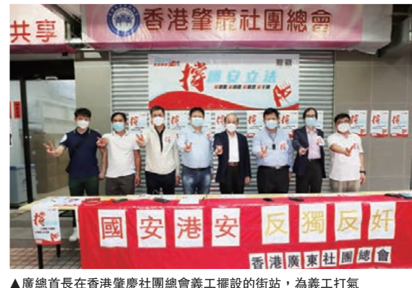
▲廣總首長在香港慶龍社團總會義工擺設的街站，為義工打氣