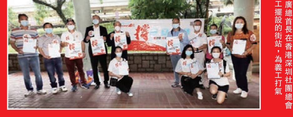
▲廣總首長在香港深圳社團總會義工擺設的街站，為義工打氣