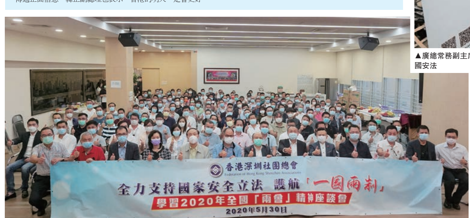
▲5月30日，香港深圳社團總會「學習2020年全國「兩會」精神座談會」於總會會所舉行

鄺美雲：香港明天會更好 全國人大代表、廣總常務副主席鄺美雲強調，維護國家安全是對國家負責，對包括香港市民在內的中國人民負責，對歷史負責，對「一國兩制」行穩致遠負責。十三屆全國人大第三次會議通過決議，包括「兩高」報告、財政報告等，最多掌聲表決制訂港區國安法。全國人大委員長栗戰書和國務院總理李克強的報告中，都提及維護國家安全是最重要，有國才有家。她續稱，在不安全、不穩定的環境，以及不能依法懲治壞人的情況下，廣大市民無法正常生活。青少年被蒙騙，不知道事實真相，更加凸顯教育推廣和文化安全的重要性。因此，大家要珍惜中央對香港的絕對支持，多宣講傳遞正面信息。韓正副總理也表示，香港的明天一定會更好。