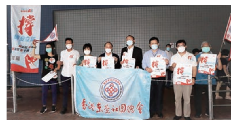
▲廣總首長在香港東莞社團總會義工擺設的街站，為義工打氣

訂立「港區國安法」有利香港。為支持全國人大制訂「港區維護國家安全法」，廣總響應「香港各界撐國安法聯合陳詞簽名行動」，聯同屬下的團體會員，在本港多個地區設立簽名街站，收集市民支持「港區國安法」立法的簽名。是次撐國安法簽名行動，得到了廣大市民的積極響應和大力支持。各站點現場所見，不少市民踴躍簽名。有市民表示，訂立「港區國安法」，可以堵塞香港在國家安全方面的法律漏洞，有利於「一國兩制」行穩致遠，有利於香港的長治久安和港人的根本福祉。