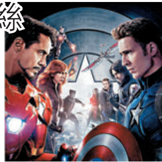
《美國隊長3：英雄內戰》劇照。

Marvel Studios 繼上個月28日起在戲院重映兩周《復仇者聯盟》及《鐵甲奇俠3》後，又公布第二浪接力，有人氣賣座電影《美國隊長3：英雄內戰》(Captain America: Civil War)和《死侍2》(Deadpool 2)已於昨日(11日)至24日在戲院限定重映，讓粉絲重溫經典的精彩演出。