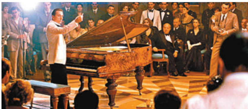
每個人聽過1900(添羅夫飾)演奏鋼琴，都會被深深打動。

影片用這位鋼琴大師悲喜交集的人生，引發觀眾對於生命與存在的無限思考，橫掃金球獎最佳電影配樂、歐洲電影獎最佳攝影等諸多獎項，相信觀眾在不同的人生時期觀看，也會有不一樣的感受和體悟。