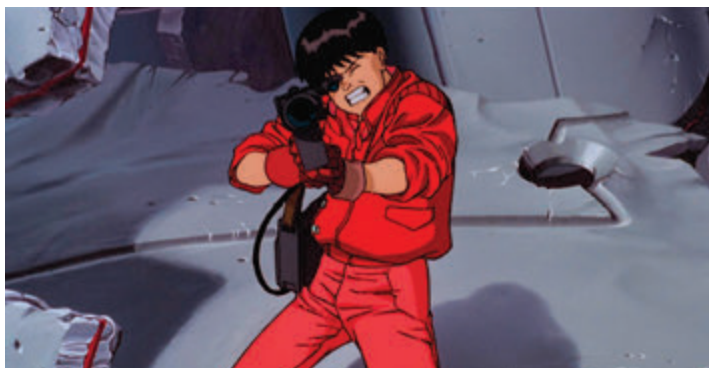
《阿基拉》預言了2020東京奧運，竟說中了奧運中止的危機。