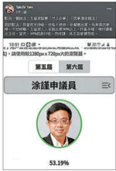
快必揸掄民主黨議員出席率低。fb截圖