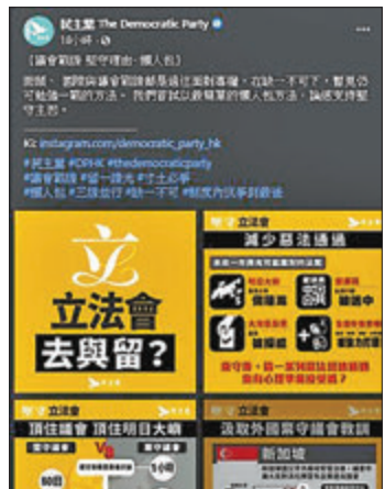
民主黨近日頻頻在社交媒體大肆宣傳其「功績」和他們延任對市民的好處。fb截圖