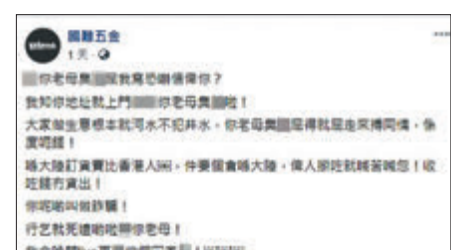
「國難五金」爆粗反問「HK Protect」老屈。