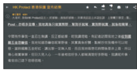
「HK Protect」稱收到「國難五金」恐嚇信。

「HK Protect」之後再喺 facebook 發長文回應，但劈頭就話自己唔會封恐嚇