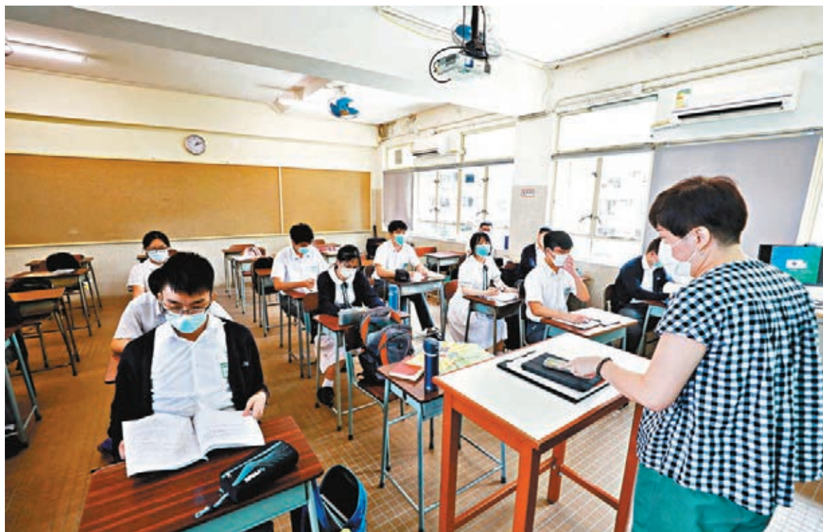
培僑中學復課首日，學生安靜上堂，用心聆聽老師教授新知識。

他指出，這次疫情令學校被迫進入電子教學時代，幸虧老師們團結一致，很快進入角色並熟悉網上教學模式。學校會隨著恢復面授，總結網課期間經驗，利用此契機開展線上線下兩面結合的「雙軌教學模式」，包括「取網課之所長」讓學生跨越空間時間隨時進行學習，又會以實體課堂固所學，追回之前進度並提升學習成效。