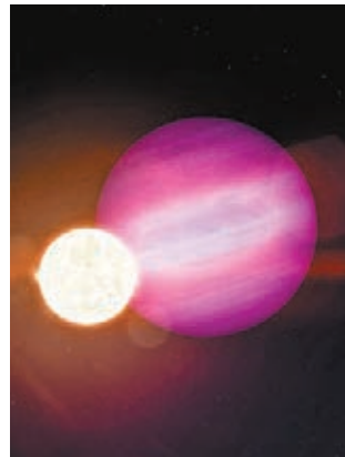
白矮星WD 1856 (較小的一顆)周圍的近軌道上有一顆體型較大的行星WD 1856 b運行。

行星可以從外太陽系向內遷移的說法一直存在，今次的發現成功證實了這個說法，令天文學家因此開展對其他白矮星的探索，以尋找這些倖存的遷徙星體。