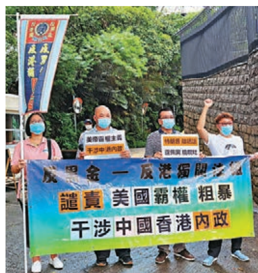
「反黑金、反港獨關注組」到美國駐港總領事館外抗議。