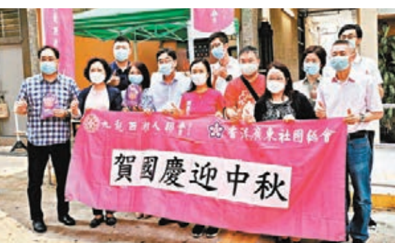
高永文和陳凱欣參加九西潮聯的社區送暖活動，向居民派發月餅和口罩。

他並認為，經過剛過去的普檢計劃，香港已吸收了寶貴經驗，特區政府應從中了解及學習操作流程，並應善