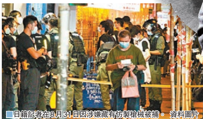
日籍記者在 8 月 31 日因涉藏有仿製槍械被捕。資料圖片

他一度在 twitter 和 facebook 相當活躍，facebook 的個人頭像即為手持氣槍的照片，亦經常轉貼氣槍資訊，但如今已經停止更新。