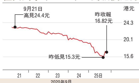
恒大汽車(0708)一周股價走勢