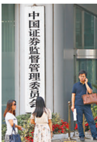
中證監表示，已督促兩家券商開展自查。證監會同時已啟動相關核查程序。資料圖片

本周最後一個交易日，滬綜指收報3,219點，跌3點或0.12%；深成指收報12,814點，跌2點或0.02%；創業板指收報2,540點，漲4點或0.18%。兩市共成交5,693億元人民幣。本周滬綜指累跌3.56%，深成指、創業板指周跌3.25%、2.14%。