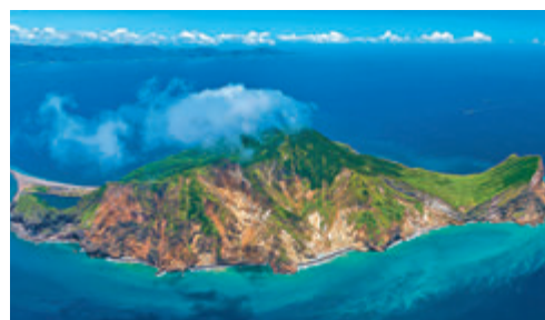
近來宜蘭龜山島「牛奶海」成大熱景點。

可選乘1晚至5晚的郵輪航線，由基隆出發到訪台南安平、澎湖、高雄及花蓮等地，或巡遊宜蘭龜山島著名景點「牛奶海」，享受久違的旅遊樂趣之餘，盡覽台灣沿海的獨特美態，在疫後的新常態下展開海上之旅。