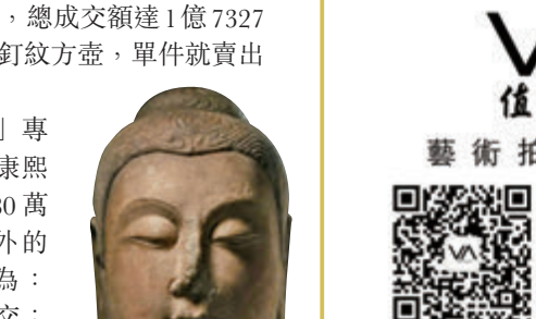
紅海水魚龍紋角蓋盞

本報自創刊以來得到了廣大讀者的歡迎和支持，現向讀者要求特闢「釋疑解難」專欄，如讀者收藏的古瓷藝術品有何疑難，可將物件拍攝成圖片電郵至：qishichu@yahoo.com.hk，我們將有專家作解答，敬請垂注為荷。