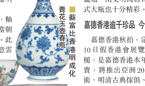
蘇富比香港 一對乾隆粉彩五子登科圖盤