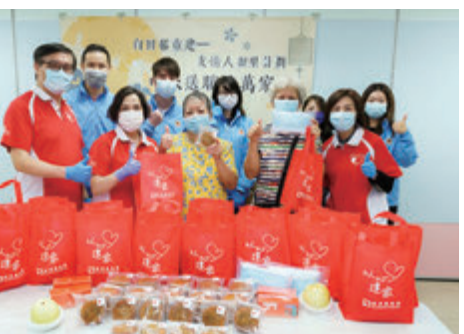
■「以心建家送暖行動」向「白田邨重建一友人情鄰里計劃」的受助長者派送福袋。

此外，考慮到疫情令不少「老友記」的社交生活大減，在需要維持社交距離的情況下，新地義工隊改以不同的方式，提供適時的支援。義工隊更組織「快閃行動」，將口派送到長者的信箱。