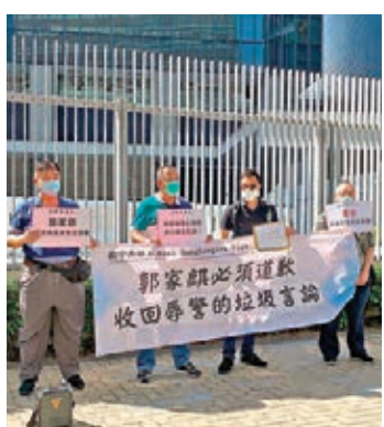
「政中香港人」要求郭家麒收回辱警言論。

香港文匯報訊(記者 子京)身為註冊醫生的攪炒派立法會議員郭家麒日前於網絡侮辱警隊，令市民均感憤怒。昨日再有市民團體到政府總部外請願，要求立法會對郭家麒作出譴責，並要求郭家麒收回「垃圾」言論。