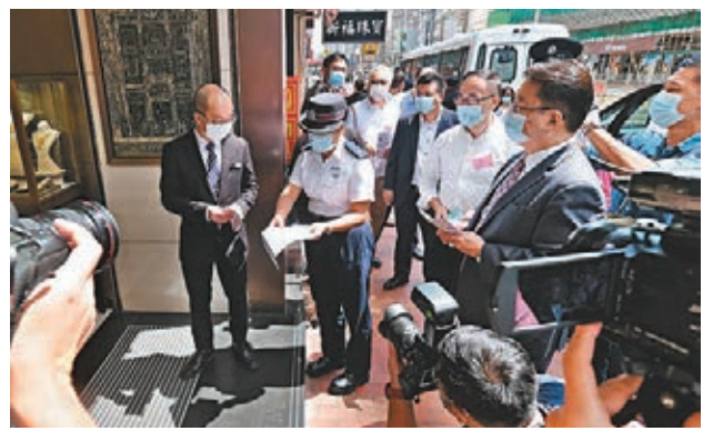
警方向金舖負責人派傳單，提醒要加強保安。

另外，他建議業界把珠寶首飾、手錶等貴重貨品編上標記或編號，以作辨認及記錄，並盡量避免將現金存放在店內，每日不定時把現金存入銀行。