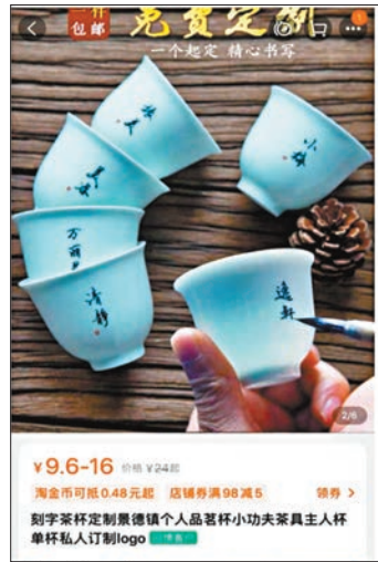
淘寶有售賣類似款式的定製杯。