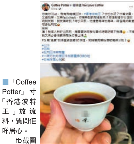
「Coffee Potter」寸「香港波特王」放流料，質問佢咩居心。fb截圖

即使「Coffee Potter」個論述咁牽強，但唔少「黃絲」網民竟然買賬，仲話要繼續「懲罰」佢，唔呢佢仲要呢邊個呀！