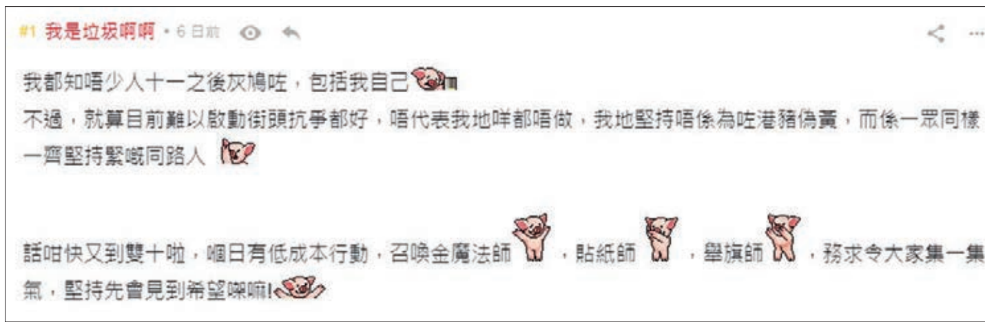
「連登仔」召集「貼紙師」和「舉旗師」，張貼「台獨」宣傳品及舉「台獨」旗。