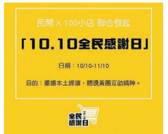
「連登仔」亦為「黃店」宣傳。